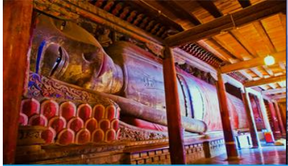
วัดพระใหญ่

พักที่ SILU QIAN XI HOTEL โรงแรมระดับ 4 ดาวท้องถิ่น หรือเทียบเท่าในเมืองจางเจีย