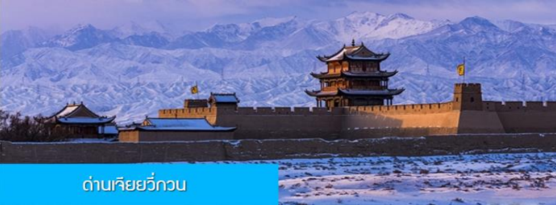
ด่านเจียยวี่กวน