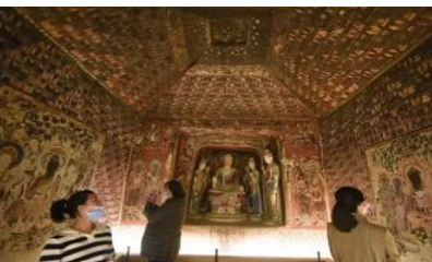
ชภาพยนตร์ 3 มิติ