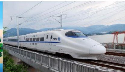
บั้งรถไฟความเร็วสูง