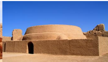
เมืองโบราณเกาซางกู๋เจิง