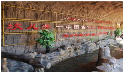
ระบบชลประทานกู๋หลู่ฟาน

พักที่ HAMPTON BY HILTON HOTEL โรงแรมระดับ 4 ดาวหรือเทียบเท่าในเมืองกู๋หลู่ฟาน