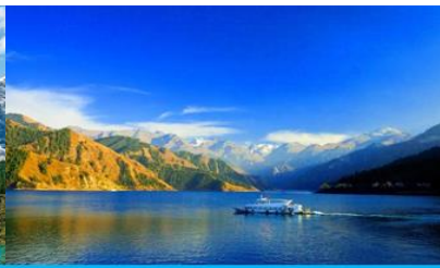
ล่องเรือทะเลสาบเทียนฉือ