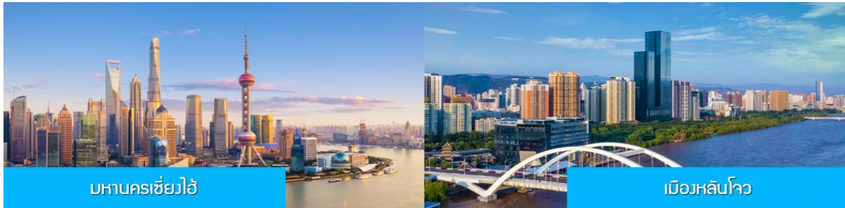
มหานครเซี่ยงไฮ้