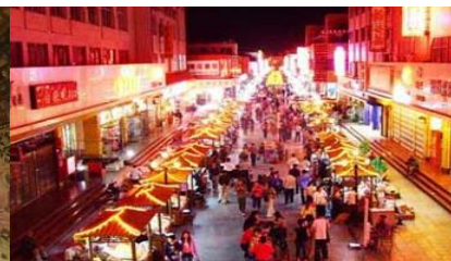
ตลาดกลางคืน ซาโจว