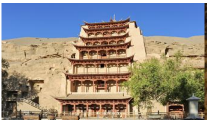
ต้าสินมั่วเกา

พักที่ REZEN HOTEL ระดับ 4 ดาวท้องถิ่นหรือเทียบเท่าในเมือง เจียยวี่กวน