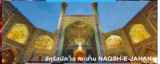
จัตุรัสนัก ไอ สะฮาน NAQSH-E-JAHAN