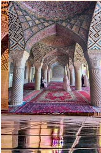
เช้า บริการอาหารเช้า

-รายการทัวร์ที่น่าเสนออาจมีการเปลี่ยนแปลง ทั้งนี้ทางบริษัทจะแจ้งให้ท่านทราบก่อนการเดินทาง 7 วัน