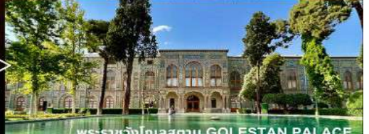
พระราชวังโกเลสถาน GOLESTAN PALACE