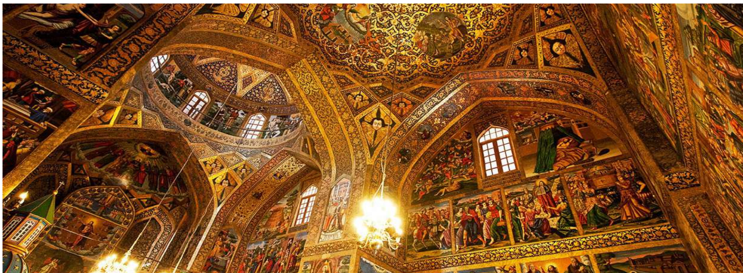
เรียบร้อย

02.10 น. เดินทางถึง สนามบินโคโมนี กรุงเตหะราน (Tehran) หลังจากผ่านพิธีการตรวจคนเข้าเมือง และเจ้าหน้าที่ศุลกากร