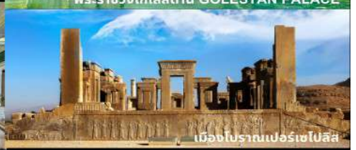
เมืองโบราณเปอร์เซโปลิส