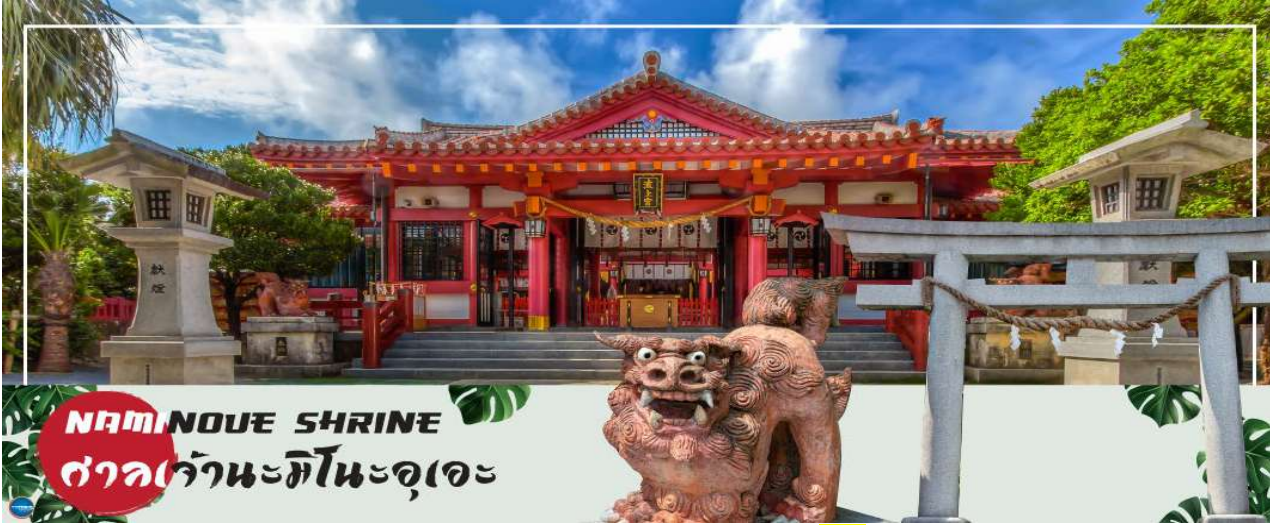
NAMINOUE SHRINE ศาลเจ้านะมิโนะอุเอะ