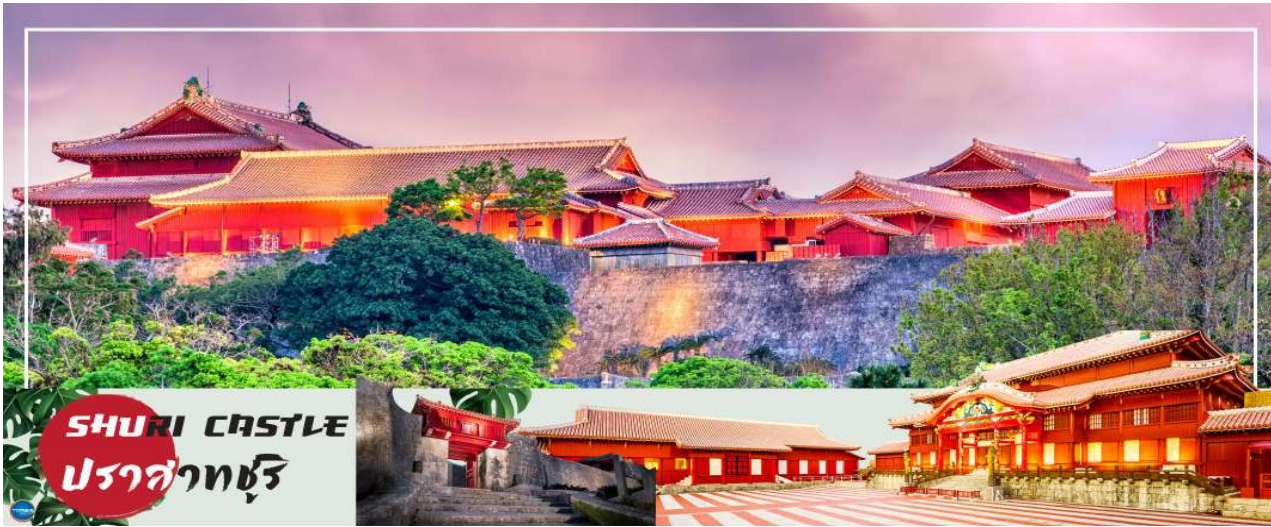
SHURI CASTLE ปราสาทชูริ