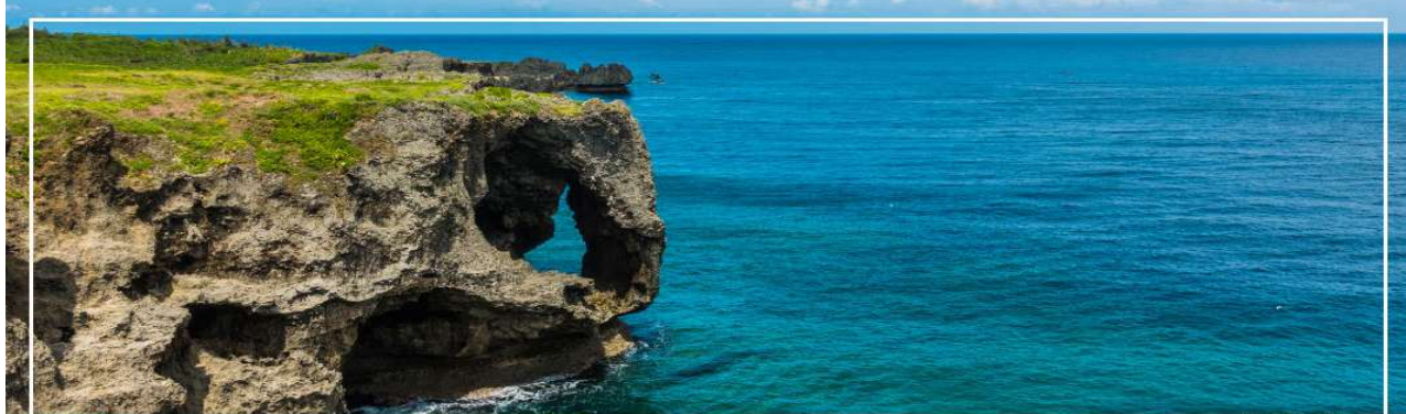
CAPE MANZAMO ผามันซาโมะ

จากนั้นนำท่านเดินทางสู่ ผามันซาโมะ (Cape Manzamo) (ใช้เวลาเดินทางประมาณ 1.20 ชั่วโมง) ผาหินที่สูงชันกว่า 30 เมตรมีลักษณะคล้ายวงช้างหันหน้าสู่ทะเลจีน พื้นที่สีเขียวของต้นหญ้าที่ขึ้นปกคลุมจนถึงยอดหน้าผาตัดกับผืนน้ำทะเลสีฟ้าใส เป็นทิวทัศน์ที่สวยงามที่สุดแห่งหนึ่งในโอกินาวา ในวันที่ท้องฟ้าสดใสจะสามารถ มองเห็นความสวยงามของเกาะทางตอนเหนือและเกาะที่อยู่นอกชายฝั่ง