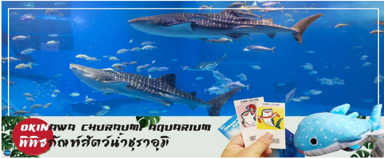
OKINAWA CHURAUMI AQUARIUM พิพิธภัณฑ์สัตว์น้ำชुरาอุมิ