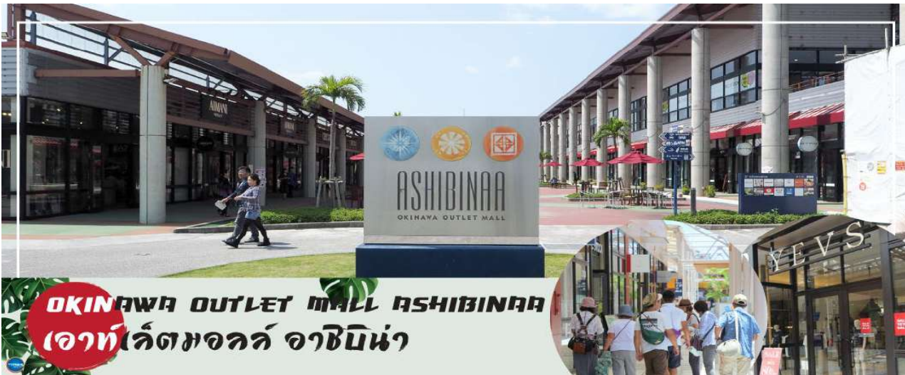
OKINAWA OUTLET MALL ASHIBINAA เอาท์เลตมอลล์ อาชิบิโน่า

จากนั้นนำท่านสู่ เอาท์เลตมอลล์ อาชิบิโน่า (Okinawa Outlet Mall Ashibinaa) (ใช้เวลาเดินทางประมาณ 30 นาที) เอาท์เลตแห่งแรกในโอกินาวะ รวบรวมร้านค้าชั้นนำกว่า 100 ร้าน ทั้ง เสื้อผ้าแฟชั่น สินค้าแบรนด์เนม นาฬิกา ข้าวของเครื่องใช้ ของเล่น ทุกร้านจัดเต็มทั้งสินค้านำเข้าและรุ่นใหม่ ลดราคากระหน่ำกว่า 30-80% ให้ได้เดินช้อปปิ้งตัดท้ายทริปกันอย่างจุใจ ภายใต้บรรยากาศสบายๆ สไตล์รีสอร์ทริมทะเล หากช้อปปิ้งจนเหนื่อยสามารถขึ้นไปทานอาหารที่ชั้น 2 มีอีกหลายร้านที่คอยให้บริการ