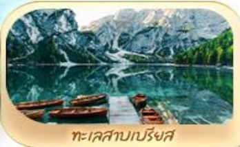
ทะเลสาบเบรียงส