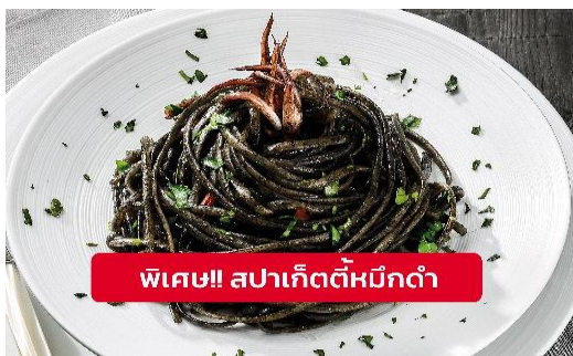
พิเศษ!! สปาเก็ตตี้หมึกดำ

Highlight! เมื่อเยือนเกาะเวนิส เมนูที่ขึ้นชื่อและหากได้มาต้องได้ลิ้มลอง สปาเก็ตตี้ผัดซอสหมึกดำที่คลุกเคล้ากับความหอมนุ่มนวลกับบรรยากาศ