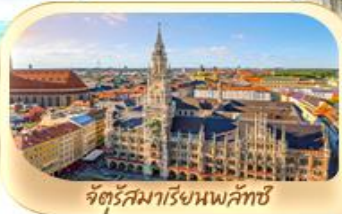
จัตุรัสมาเรียนพลักซ์