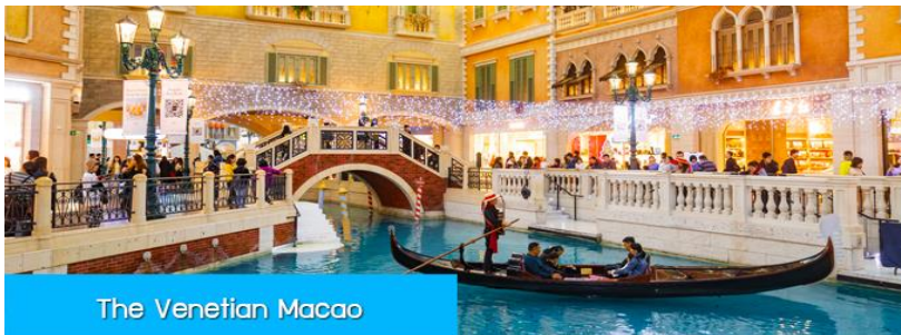
The Venetian Macao