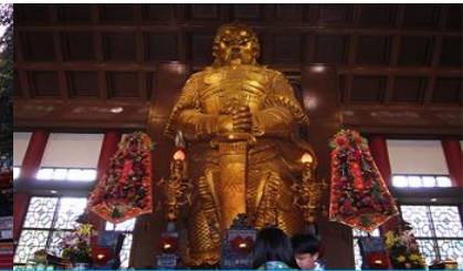
วัดแชกงเมียว