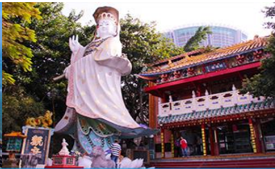
อ่าว Repulse Bay