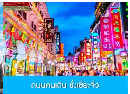
ถนนคนเดิน ซังเซี่ยะจิว