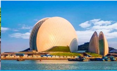
โรงละครจูไห่