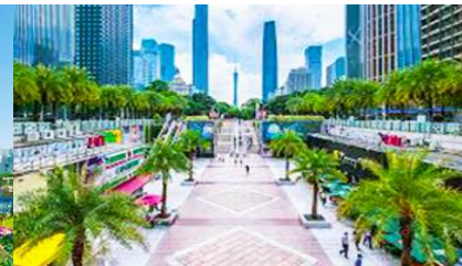
จตุรัสฮิวเว็ว