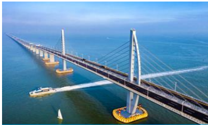
สะพาน ฮองกง จูไห่ มาเก๊า

พักที่ IRVINE HOLIDAY HTL OR HUICHANG HTL 3* หรือ โรงแรมในระดับเดียวกันในเมืองจูไห่