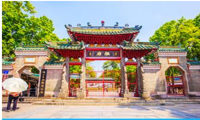
วัดจุ้เมี่ยว

23.30 น. คณะพร้อมกัน ณ ท่าอากาศยานสุวรรณภูมิ อาคารผู้โดยสารขาออก ชั้น 4 ประตู 10 เคาน์เตอร์สายการบิน 9AIR พบเจ้าหน้าที่บริษัทฯ คอยให้การต้อนรับและอำนวยความสะดวกด้านเอกสารและสัมภาระก่อนการเดินทาง