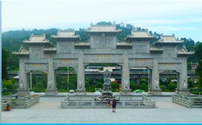
วัดญี่โกวซื่อ