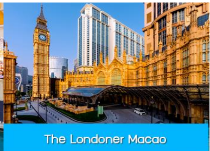
The Londoner Macao

นำคณะขึ้นรถ Shuttle Bus ของ โรงแรมเดินทางสู่ เดอะปารีสเซียน มาเก๊า The Parisian Macao และ เดอะลอนดอนเนอร์ the Londoner Macao อัครสถานบันเทิงที่สร้างขึ้นเป็นดาวดวงใหม่ที่เจิดจรัสอยู่เหนือเกาะ