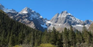
ภูเขาสี่ดรุณี (หุบเขาซวงเจียวโกว)