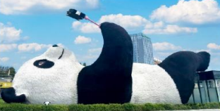
รูปปั้นหมีแพนด้าอนเซลฟี่