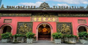
วัดต้าเจ้อ

*ทางบริษัทฯ ขอสงวนสิทธิ์ในการสลับโปรแกรมทัวร์ตามความเหมาะสมขึ้นอยู่กับสถานการณ์หน้างาน โดยคำนึงถึงผลประโยชน์ของลูกค้าเป็นสำคัญ