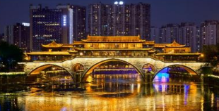
สะพานอันซุน