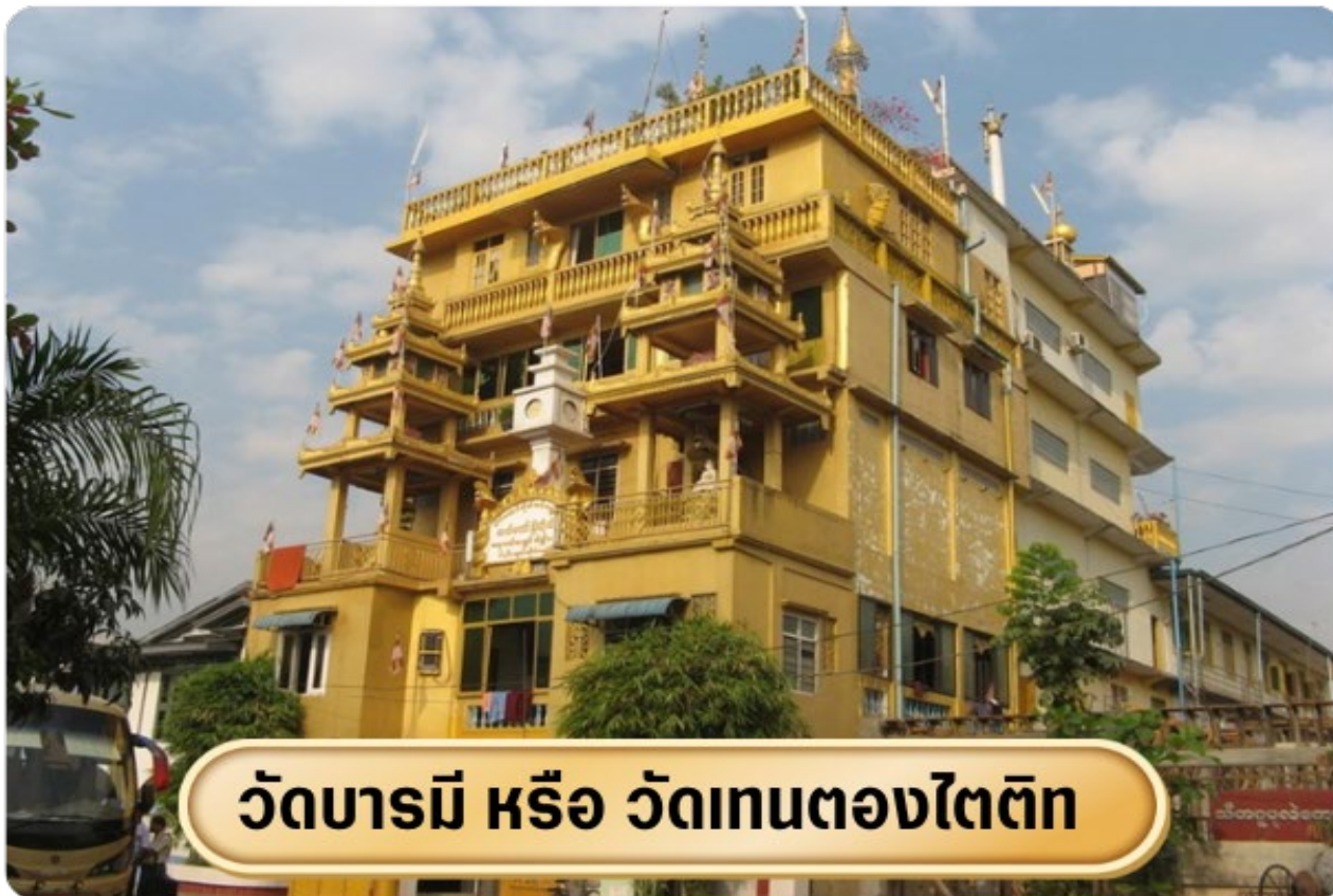
วัดบารมี หรือ วัดเทนตองโตตัก

นำท่านสู่ วัดเทนตองโตตัก หรือที่เรียกกันทั่วไปว่า วัดบารมี อยู่ที่เมืองย่างกุ้ง ประเทศพม่า วัดนี้มีชื่อเสียงโด่งดังในเรื่องพระเกศาธาตุของพระพุทธเจ้า ซึ่งมีความอัศจรรย์ตรงที่สามารถเคลื่อนไหวได้ และยังมีพิพิธภัณฑ์พุทธธรรมพระธาตุของสาวกพระพุทธเจ้า เช่น พระโมคคัลลา พระสิวลี พระสารีบุตร พระพากลเถระ ที่ต้องมาขอพรในเรื่องโชคลาภหรือธุรกิจการค้า แนะนำมาขอที่วัดแห่งนี้ได้เช่นกัน ซึ่งปัจจุบันมีนักธุรกิจและนักการเมืองที่มีชื่อเสียงเดินทางมาทำพิธีขอพรกันมากมาย ได้เวลาอันสมควรนำท่านเดินทางสู่สนามบิน