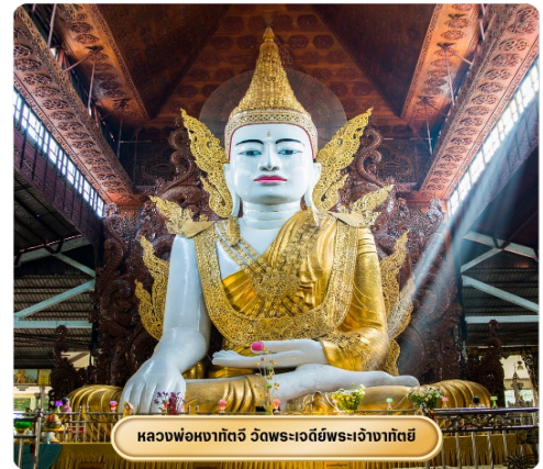
หลวงพ่อหงาทัตย์ วัดพระเจดีย์พระเจ้างาทัตย์

จากนั้นนำท่านสู่ วัดพระเจดีย์พระเจ้างาทัตย์ นำท่านนมัสการพระประธานในวัด ซึ่งเป็นพระพุทธรูปนั่งปางมารวิชัยสีขาว ทรงเครื่องแบบพม่า มีขนาดสูงใหญ่มากๆ ประดิษฐานอยู่ในวิหารที่มองจากด้านนอกจะเห็นหลังคาข้างบนคล้ายเจดีย์ทรงสี่เหลี่ยม ชาวพม่าศรัทธา พระพุทธรูปองค์นี้อย่างมาก ในแต่ละวันจะเห็นคนมานั่ง ทำสมาธิด้านหน้าองค์พระ คนที่มา ที่วัดนี้ส่วนมากจะเป็นชาวพม่าหรือชาวไทยใหญ่ และคนที่เดินทางมาจากรัฐฉาน วัดพระเจดีย์พระเจ้างาทัตย์ เวลาออกเสียงจะได้ยินชาวพม่าออกเสียงเร็วๆ คล้ายๆ คำว่างาทะจี