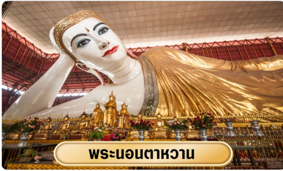
พระนอนตาหวาน