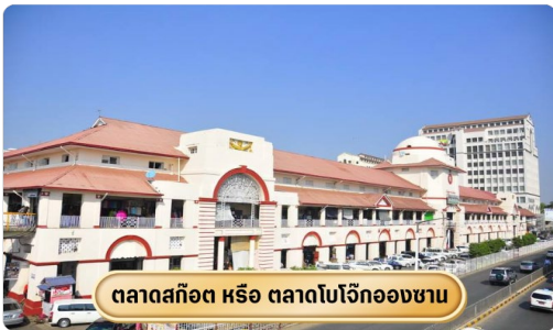
ตลาดสก๊อต หรือ ตลาดโบโจ๊กอองซาน

จากนั้นนำท่านช้อปปิ้ง สินค้าของฝากที่ ตลาดสก๊อต หรือเรียกอีกอย่างว่า ตลาดโบ-ยก อองซาน เป็นตลาดสำคัญของเมืองย่างกุ้ง โดยของขึ้นชื่อที่ตลาดแห่งนี้คือ "หยกพม่า" ซึ่งได้รับความนิยมจากนักท่องเที่ยวเป็นอย่างมาก นอกจากนี้ยังถือเป็นตลาดที่มีสินค้าหลากหลายชนิดให้เลือกซื้อ ทั้งข้าวของเครื่องใช้ ของฝากของที่ระลึก เสื้อผ้า ไปจนถึงอาหาร