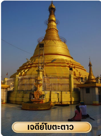
เจดีย์โบตตะดาว

นำท่าน เจดีย์โบตตะดาว หมายถึง "ทหาร 1,000 นาย" เจดีย์แห่งนี้เคยบรรจุพระเกศาธาตุของพระพุทธเจ้า ก่อนที่จะเชิญประดิษฐาน ณ เจดีย์ชเวดากอง ซึ่งถูกค้นพบ จากการที่ถูกระเบิดของฝ่ายสัมพันธมิตรลงกลางเจดีย์ ซึ่งภายในเจดีย์แห่งนี้สวยงามตกแต่งด้วยสีทองอร่าม ประดิษฐานพระพุทธรูปทองคำ ปางมารวิชัยที่สวยงาม ซึ่งจุดเด่นที่ทำให้วัดแห่งนี้เป็นที่รู้จักอย่างกว้างขวางคือ "รูปปั้นเทพหินใจ" หรือ นัตโบโบยี เป็นที่สักการะยอดนิยม และเป็นทีนับถืออย่างมากของชาวมอญ และพม่าในย่างกุ้ง เชื่อว่าหากอธิษฐานขอพรสิ่งใดแล้วจะได้ตามขอ สมปรารถนาทันใจเลยทีเดียว สมควรแก่เวลาท่านขอพรจาก "เทพกระซิบ" หรือ เมียะนานหน่วย" ประทับอยู่ฝั่งตรงข้ามกับเจดีย์โบตตะดาว เทพกระซิบเป็นธิดาของพญานาคที่มีความศรัทธาต่อพระพุทธศาสนา เชื่อกันว่าถ้ากระซิบขออะไรแล้วจะสมหวัง