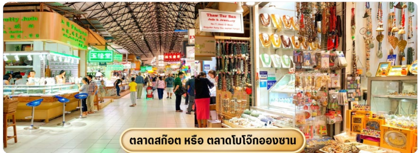
ตลาดสก๊อต หรือ ตลาดโบโจ๊กอองซาน