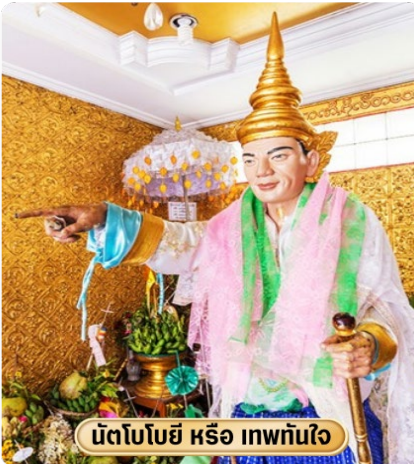
นัตโบโบยี หรือ เทพหินใจ