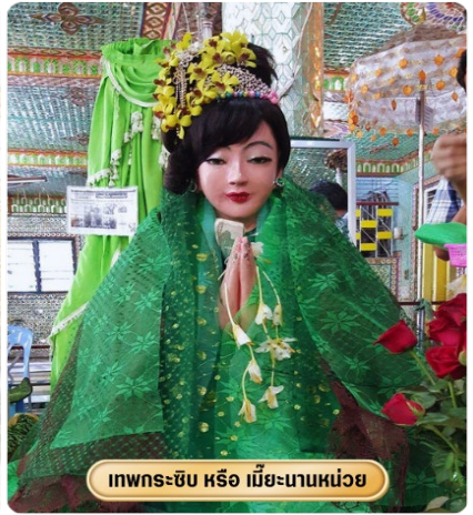
เทพกระซิบ หรือ เมียะนานหน่วย