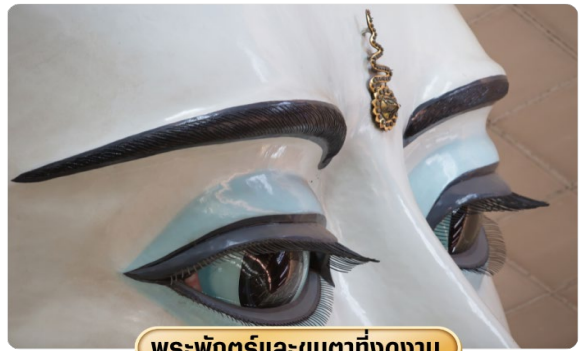
พระพักตร์และขนตาที่งดงาม

จากนั้นนำท่านสู่ วัดพระเจดีย์พระเจ้างาทัตย์ นำท่านนมัสการพระประธานในวัด ซึ่งเป็นพระพุทธรูปนั่งปางมารวิชัยสีขาว ทรงเครื่องแบบพม่า มีขนาดสูงใหญ่มากๆ ประดิษฐานอยู่ในวิหารที่มองจากด้านนอกจะเห็นหลังคาข้างบนคล้ายเจดีย์ทรงสี่เหลี่ยม ชาวพม่าศรัทธา พระพุทธรูปองค์นี้อย่างมาก ในแต่ละวันจะเห็นคนมานั่ง ทำสมาธิด้านหน้าองค์พระ คนที่มา ที่วัดนี้ส่วนมากจะเป็นชาวพม่าหรือชาวไทยใหญ่ และคนที่เดินทางมาจากรัฐฉาน วัดพระเจดีย์พระเจ้างาทัตย์ เวลาออกเสียงจะได้ยินชาวพม่าออกเสียงเร็วๆ คล้ายๆ คำว่างาทะจี