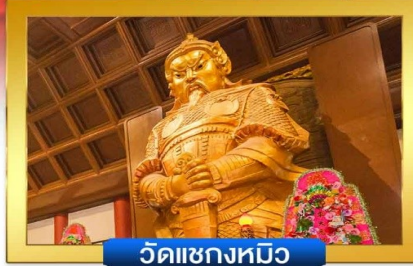
วัดฯขงทมิว

📍 อิสระ-ซ้อปปิงย่านจิมซาจู้ & คอสเวย์เบย์