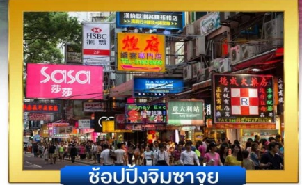
ซ้อปปิงจิมซาจู้