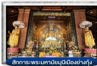
สักการะพระมหาโมนินเมืองย่างกุ้ง