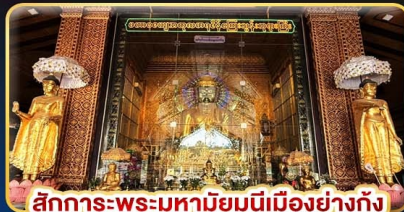
สักการะพระมหาสิริมหานีเมืองย่างกุ้ง