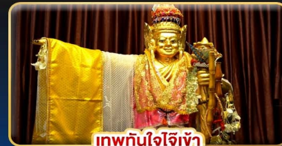
เทพทันใจใจีเข้า