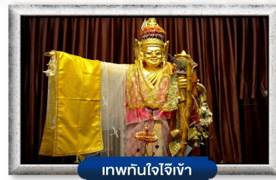
เทพทันใจใจเจ้า