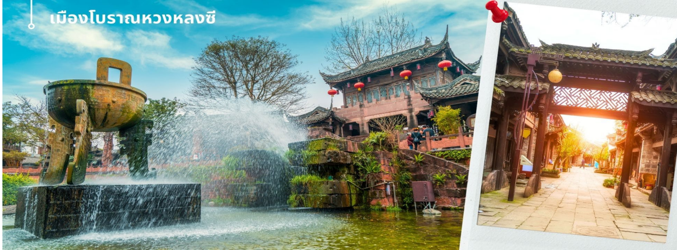
เมืองโบราณหวงหลงซี

เช้า ๑๐) รับประทานเช้า ณ ภัตตาคาร (8) นำทุกท่านยุคกลับสู่เมืองจีนสมัยก่อนชม เมืองโบราณหวงหลงซี คล้ายคลึงกับเมืองโบราณลี่เจียงที่ได้รับมรดกโลก สัมผัสบรรยากาศเก่าๆ ตลอดเข้าหวงหลงซี เป็นหมู่บ้านสมัยราชวงศ์หมิง ตั้งอยู่ริมแม่น้ำหวงหลงซี ในอดีตเคยเป็นเมืองท่าริมน้ำที่มีเรือสัญจรไปมาคับคั่งการค้าขายคึกคักมาก ปัจจุบันยังเหลือให้เห็นบรรยากาศเก่าๆ ได้ทั่วไป เช่น โรงน้ำชา วัดเก่าแก่ ต้นไม้โบราณ และวิถีชีวิตของชาวบ้านนั่งเล่นพักผ่อนเป็นกลุ่มๆ ดื่มน้ำชาได้ร่มไม้ริมทางน้ำ อาคาร