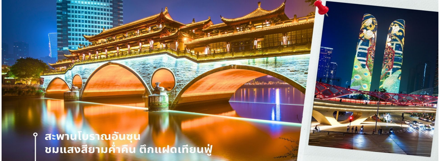
สะพานโบราณอันซุน ชมแสงสียามค่ำคืน ตึกแฝดเทียนฟู

เทียนฟู โดยในช่วงค่ำเวลา ประมาณ 19.00-22.00 น. ทั้ง 2 ตึกจะเป็นไฟ LED สวยงามโดดเด่นมาก ตึกแฝดเทียนฟู หรือที่เรียกอย่างเป็นทางการว่าตึกศูนย์การเงินนานาชาติเทียนฟู เป็นตึกระฟ้าที่สวยงามโดดเด่นสองตึกในย่านการเงินของเฉิงตู ตึกแต่ละตึกมีความสูง 58 ชั้นและสูงกว่า 700 ฟุต ตึกเหล่านี้โดดเด่นเป็นพิเศษด้วยภายนอกที่หุ้มด้วยไฟ LED ที่เป็นเอกลักษณ์ ซึ่งเปลี่ยนอาคารให้กลายเป็นจอภาพดิจิทัลขนาดใหญ่