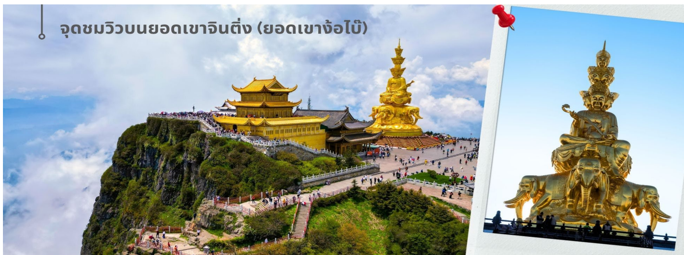
จุดชมวิวบนยอดเขาจินตึง (ยอดเขาจ้อไบ๊)

หลังอาหารเช้าท่านเดินทางสู่เขาจ้อไบ๊ นำท่านเปลี่ยนเป็นรถท้องถิ่นขึ้นภูเขาแล้วนั่งกระเช้าลอยฟ้าขึ้นสู่ จุดชมวิวบนยอดเขาจินตึง (ยอดเขาจ้อไบ๊) (รวมกระเช้า+รถอุทยานฯ) ที่มีความสูงจากระดับน้ำทะเล 3,077 เมตร ท่านจะได้เห็นทิวทัศน์อันสลับซับซ้อนไปด้วยขุนเขาเหนือชั้นเมฆที่สวยงามดุจตั้งสวรรค์ นมัสการสิ่งศักดิ์สิทธิ์บนเขา องค์ผู้เสียนทรงช้าง (สมันตภัทรโพธิสัตย์) พระพักตร์ 10 ทิศ สูง 48 เมตร ชมตำหนักทอง ตำหนักเงิน ตำหนักสำริด และตำหนักเหล็ก