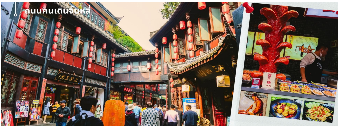
ถนนคนเดินจินหลี่

เที่ยง ๑๑) รับประทานเที่ยง ณ ภัตตาคาร (9) หลังอาหารนำท่านเดินทางสู่ เมืองเฉิงตู (ใช้เวลาเดินทางประมาณ 1.30 ชั่วโมง) นำท่านเดินเล่น ถนนคนเดินจินหลี่ เป็นหนึ่งในสถานที่ท่องเที่ยวที่น่าสนใจที่สุดสำหรับผู้ชื่นชอบประวัติศาสตร์และวัฒนธรรมจีน หมู่บ้านโบราณแห่งนี้มีความสำคัญอย่างยิ่งในเรื่องของประวัติศาสตร์ที่ยาวนานถึง 1,800 ปี ซึ่งเต็มไปด้วยวัฒนธรรมและขนบธรรมเนียมที่