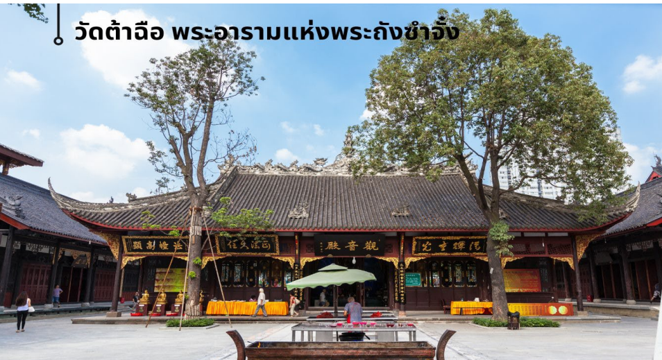
วัดต้าฉือ พระอารามแห่งพระถังซำจั๋ง

นำท่านชม วัดต้าฉือ (พระอารามแห่งพระถังซำจั๋ง) ใจกลางนครเฉิงตู พระถังซำจั๋ง ได้รับการสรรเสริญว่าเป็นผู้มีความเพียร และมีชื่อเสียงมายาวนานกว่า 1,400 ปี และยังได้รับการยกย่องว่าเป็น พระไตรปิฎกแห่งราชวงศ์ถัง พุทธประวัติของพระถังซำจั๋งถูกจารึกในสถานที่ต่างๆมากมาย รวมไปถึงได้ถูกกล่าวถึงในจดหมายเหตุหลายเล่ม ตามเส้นทางทาง