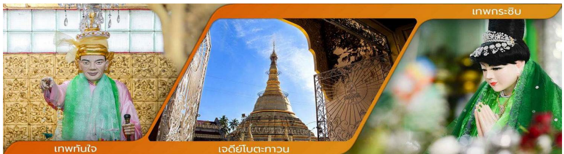
เทพทันใจ

วิธีการสักการะรูปปั้นเทพทันใจ (นัตโบโบยี) เพื่อขอสิ่งใดแล้วสมตามความปรารถนาก็ให้เอาดอกไม้ ผลไม้ โดยเฉพาะมะพร้าวอ่อน ก้อย จากนั้นก็ให้เอาเงินจะเป็นดอลลาร์ บาท หรือจ๊าด ก็ได้ แล้วเอาไปใส่มือของนัตโบโบยี 2 ใบ ไหว้ขอพรแล้วดื่อกกลับมา 1 ใบ เอามาเก็บรักษาไว้ จากนั้นก็เอาหน้าผากไปแตะกับนิ้วชี้ของนัตโบโบยี แค่นี้ท่านก็จะสมตามความปรารถนาที่ตั้งใจไว้ คำบูชาเทพทันใจ เอหิ สักกะ มหานัทโปิระโปิระจีโปตะถ่องสิทธิมัตถุ อิทังพะลัง เอตัสสะมิงรัตตะนัง พุทธัง ธัมมัง สังฆัง เทวานัง ประสิทธิลาโภ ชโยนิจจัง วันทามิสัพพะทา สวาโหม