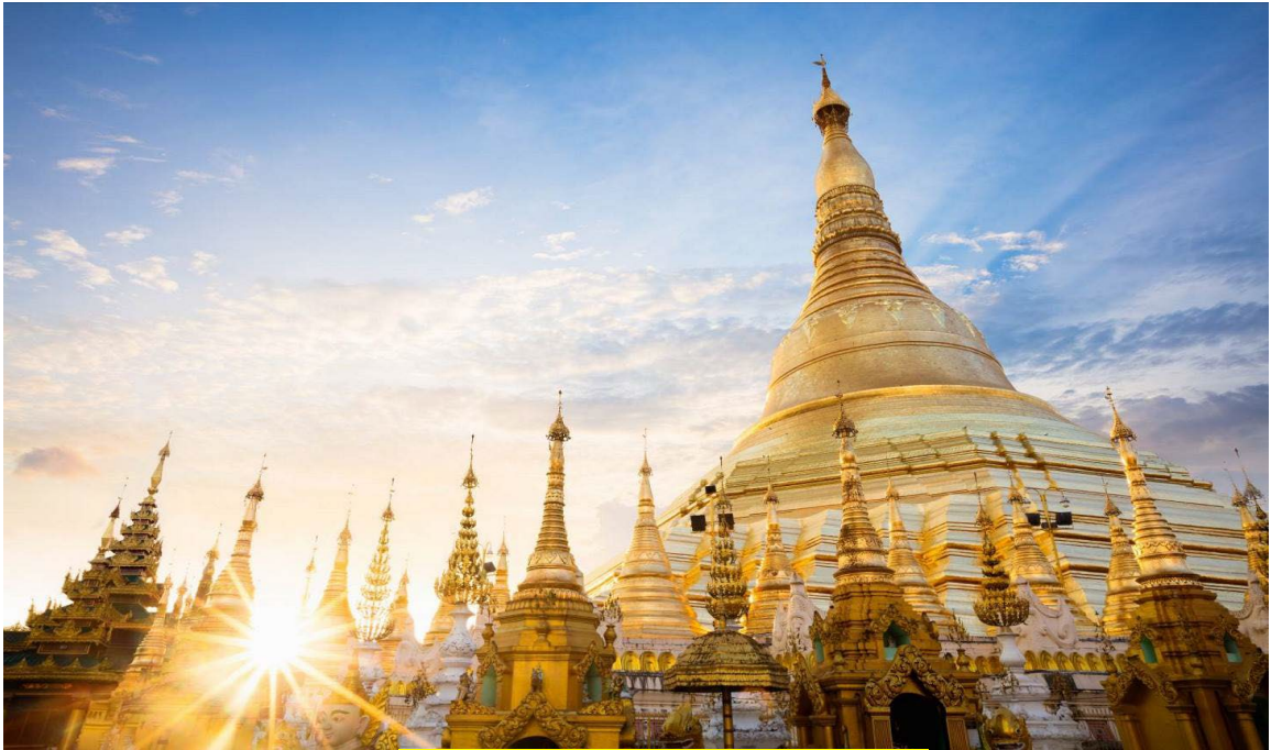
บพสวดมนต์บูชาพระมหาเจดีย์ชเวดากอง

วันทามิ อุตตมะ ชมพู วรรณานะ สิงกุตตะเร มะโนลัมเม สัตตัง สรวัตนะ ปฐมัง กกุสันธัง สุวรรณะ ตันตัง ธาตุโย ธัสสะติ ทุตติยัง โภนาคะมะนัง ธัมมะ การะนัง ธาตุโย ธัสสะติ ตติยัง กัสสปัง พุทธจีวะรัง ธาตุโย ธัสสะติ จตุกัง โคตะมัง อิตตะเกศา ธาตุโย ธัสสะติ อหัง วันทามิ ตูระโต อหัง วันทามิ ธาตุโย อหัง วันทามิ สัพพะทา อหัง วันทามิ สิระสา