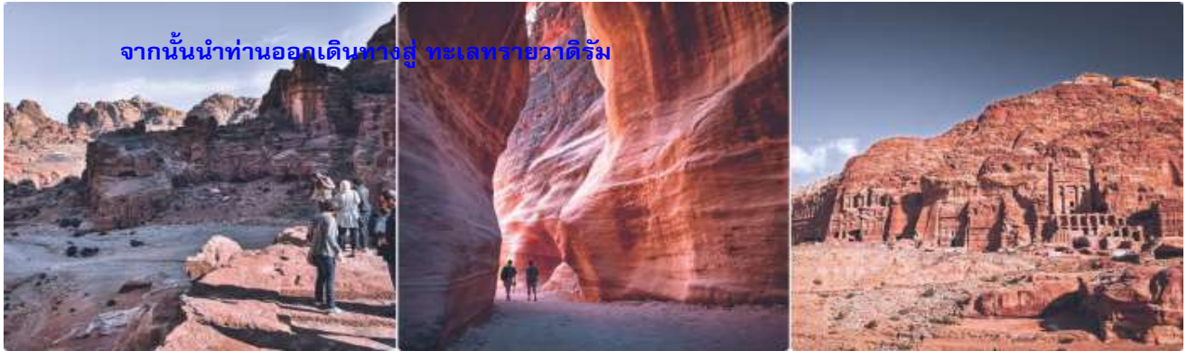
จากนั้นนำท่านออกเดินชมทุ่ง ทะเลทรายวาดีรัม

ค่ำ รับประทานอาหารค่ำ ณ แคมป์ที่พัก ที่พัก LUXURY RUM MAGIC CAMP (BUBBLE TENT) หรือเทียบเท่า