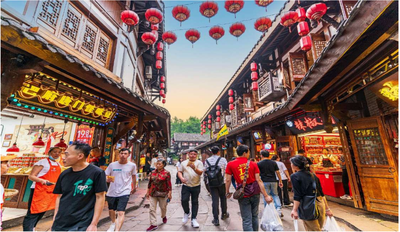
เที่ยง รับประทานอาหารเที่ยง ณ ร้านอาหาร