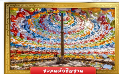
ชมมนต์อธิษฐาน