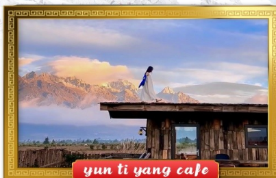
yun ti yang cafe