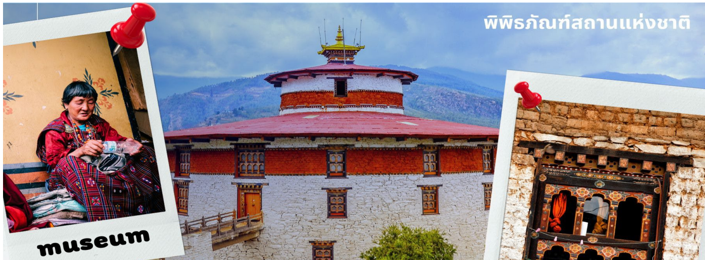
พิพิธภัณฑสถานแห่งชาติ

นำท่านเดินทางไม่ไกล ชม พิพิธภัณฑสถานแห่งชาติ พิพิธภัณฑสถานแห่งนี้เป็นที่เก็บรวบรวมหน้าากศิลปะแบบพุทธมหายาน ศึกษาดันตระ ภาพพระบฏ อวูธ เหริยญกษาปณ์ เครื่องมือเครื่องใช้ไม้สอยต่างๆ รวมถึงจัดแสดงความ