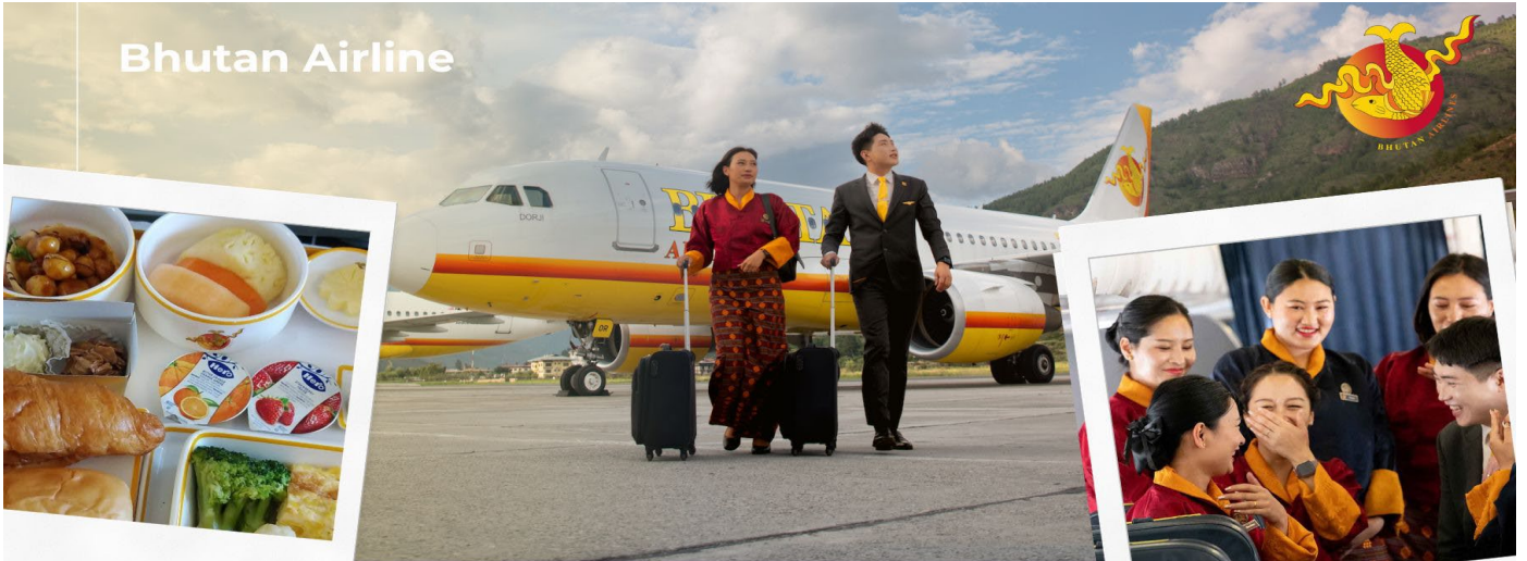
(เครื่องบินแวะรับ-ส่งผู้โดยสารที่เมืองกัลกัตตา ประเทศอินเดียประมาณ 45 นาที ***ไม่ต้องลงจากเครื่อง***)

09.55 น. เดินทางถึงสนามบินพารา ประเทศภูฏาน นำท่านผ่านพิธีการตรวจคนเข้าเมือง จากนั้นแต่ละท่านรับกระเป๋าสัมภาระที่โหลดตรวจเช็คให้เรียบร้อยและออกเดินทางเข้าสู่ตัว เมืองพารา ประเทศภูฏาน เป็นประเทศเล็กๆที่เป็นดินแดนรวมแหล่งอารยธรรมต่างๆในอ้อมกอดแห่งขุนเขาหิมาลัย เป็นประเทศที่พุทธศาสนาแบ่งบานอยู่ท่ามกลางเทือกเขาหิมาลัย ประชาชนชาวภูฏานมีธรรมะเป็นสิ่งยึดเหนี่ยวทางจิตใจ ประชาชนดำรงชีวิตกันอย่างเรียบง่ายไม่วุ่นวาย และความสุขของคนภูฏานวัดกันได้ที่ใจ..ความสุขอยู่ที่จิตใจที่มีแต่รอยยิ้ม..และความเป็นมิตรแก่ผู้คนทั้งโลก ทุกท่านจะได้สัมผัสบ้านเมืองที่ เมืองพาราซึ่งเป็นเมืองที่ถูกโอบอยู่ในวงล้อมของขุนเขา บนระดับความสูง 2,280 เมตร มีแม่น้ำปาซูลไหลผ่าน อาคารบ้านเรือนจะเป็นสไตล์ภูฏานแท้ กรอบหน้าต่างไม้ลวดลายสีสนสไต