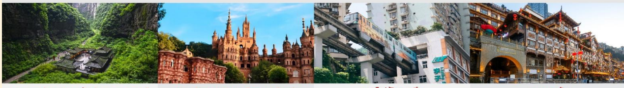
อุทยานแห่งชาติหลุมฟ้า 3 สะพานสวรรค์