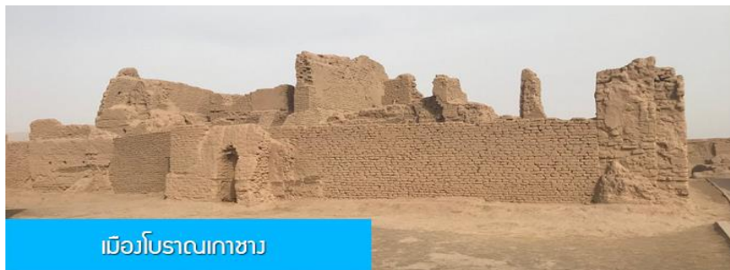
เมืองโบราณเกาซาง