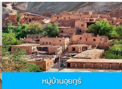
หมู่บ้านอูยгур์

หลังอาหารเช้าทุกท่านเที่ยวชม เมืองโบราณเกาซาง 高昌古城 เป็นเมืองโบราณที่สร้างในสมัย ราชวงศ์ฮั่น เดิมเป็นด่านปราการป้องกันการรุกรานของข้าศึกทางด้านดินแดนตะวันตก ต่อมาได้กลายเป็นด่านทางยุทธศาสตร์สำคัญทางการทหาร เมืองโบราณกินพื้นที่ราว 2.3 ล้านตารางเมตร ตั้งอยู่ในแอ่งกระทะที่ล้อมรอบด้วยภูเขา เคยเป็นเมืองสำคัญในภาคตะวันตกตั้งแต่ 2,500 ปีที่แล้ว