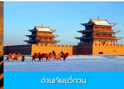
ด่านเจียวกวน