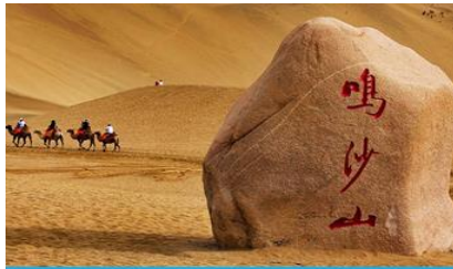
เนินทรายหมีราชา

พักที่ REZEN HOTEL ระดับ 4 ดาวห้องดีนหรือเทียบเท่าในเมือง เจียยวี่กวน