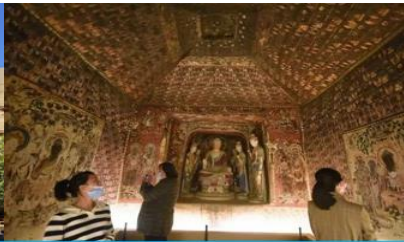
ชมภาพยพนตร์ 3 มิติ