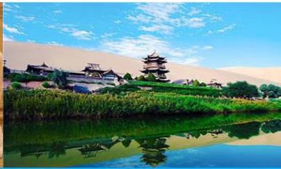
สระน้ำวพระจันทร์