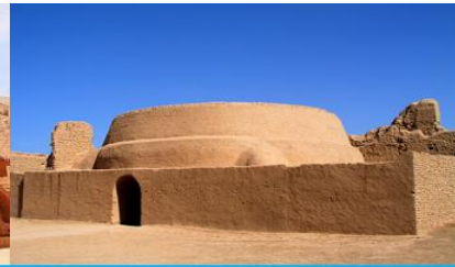
เมืองโบราณเกาซางกูเจิง

วันที่หก ชมระบบชลประทานคู่หลู่ฟาน – ถ้ำพระพันองค์- เมืองโบราณเกาซางกูเจิง-หมู่บ้านอูยгур์ –เดินทางสู่เมืองอูรูมฉี