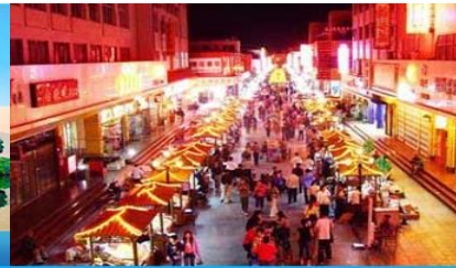
ตลาดกลางคืน ซาโจว