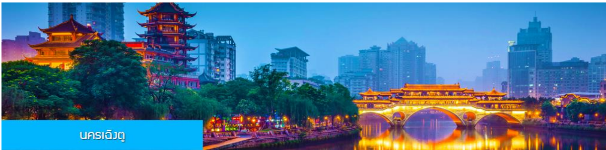
นครเจียงตู

** รายการทัวร์ข้างต้นอาจมีการเปลี่ยนแปลงตามความเหมาะสม **