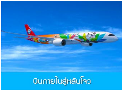
บินภายในสู่หลันโจว

พักที่ JOYHUB CHEER HOTEL โรงแรมระดับ 4 ดาวท้องถิ่น หรือเทียบเท่าใกล้สนามบินเฉิงตู