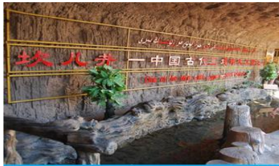
ระบบชลประทานคู่หลู่ฟาน