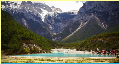
อุทยานไป๋ส่วยเหอ (หุบเขาพระจันทร์สีน้ำเงิน)