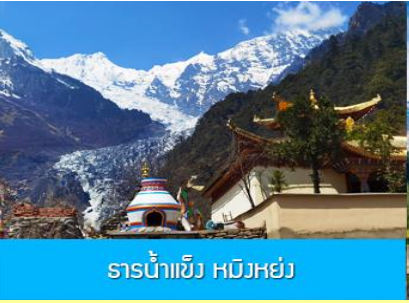
ธารน้ำแข็ง หมิวหย่ง