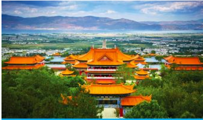
เมืองต้าหลี่