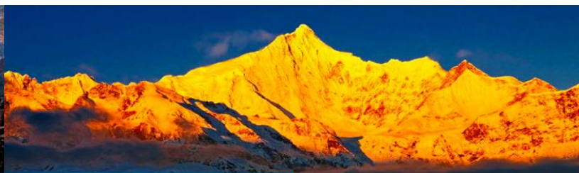
จุดชมวิว ภูเขาหิมะ