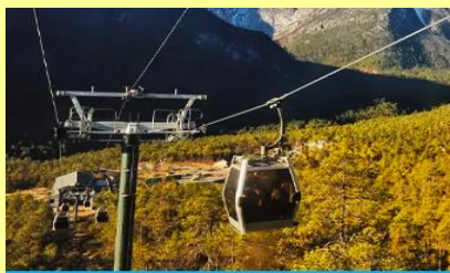
นั่งกระเช้าสถานี หยุนชานผิง