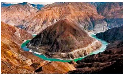
โค้งแรกของแม่น้ำจินซาเคียว

พักที่ PHOENIX HOTEL โรงแรมระดับ 4 ดาวท้องถิ่น หรือเทียบเท่าในเมืองเซี่ยงไฮ้