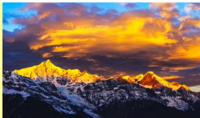
ภูเขาหิมะเหมยหยี่