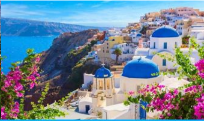
ย่านซานโตรินี่