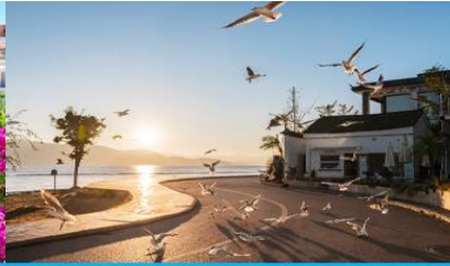
ย่านชายหาดรูป S