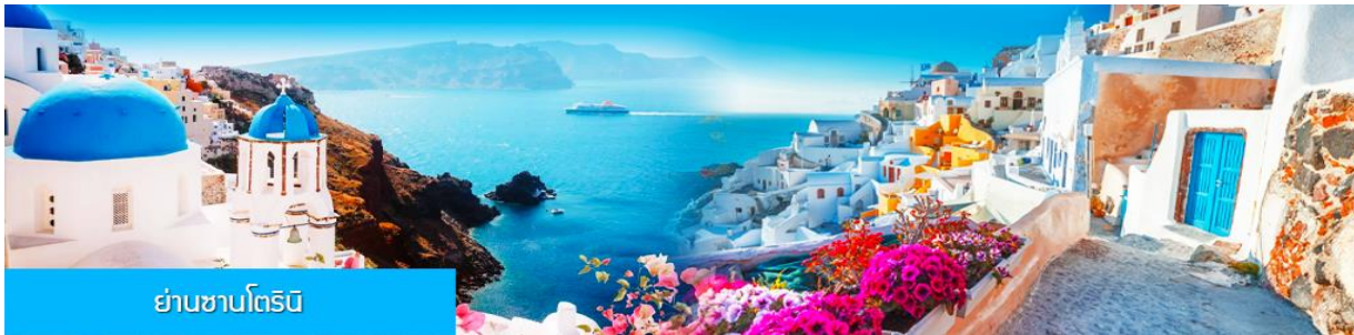
ย่านซานโตรินี่