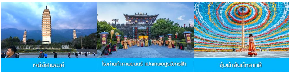
เจดีย์สามองค์

พักที่ DALI ZHUANGYUAN HOTEL โรงแรมระดับ 4 ดาวท้องถิ่น หรือเทียบเท่าในเมืองต้าหลี่