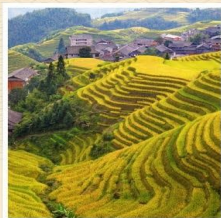
นาขั้นบันไดหลงจี