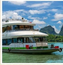
ล่องเรือแม่น้ำ หลีเจียง