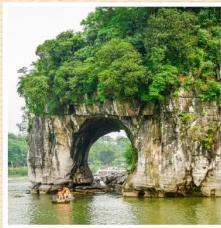
เขางวงช้าง