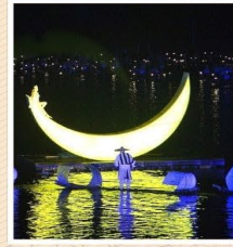
IMPRESSION LIU SANJIE