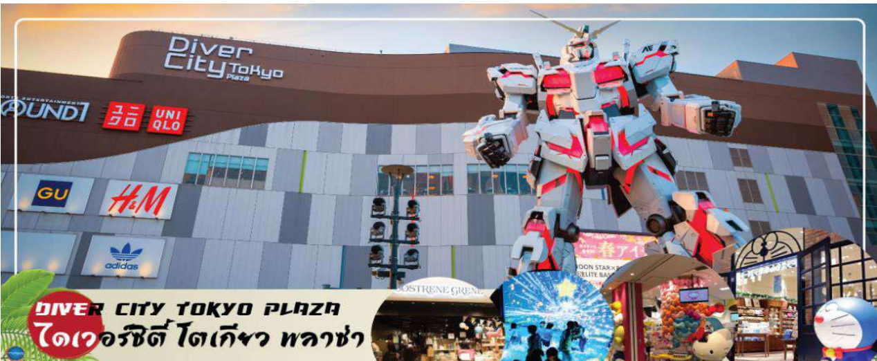
DIVER CITY TOKYO PLAZA ไดเวอร์ซิตี โตเกียว พลาซ่า

จากนั้นเดินทางสู่ ย่านโอไดบะ (Odaiba) เมืองคือเกาะที่สร้างขึ้นไว้เป็นแหล่งช้อปปิ้ง และแหล่งบันเทิงต่างๆ ในอ่าวโตเกียว ได้รับการปรับปรุงใหม่ชื่อเสียงและเป็นที่นิยมในช่วงหลังของปี 1990 นอกจากนี้มีสถาปัตยกรรมที่สวยงามตั้งอยู่มากมายแล้ว แต่ก็ยังคงความเป็นธรรมชาติไว้ด้วยความอุดมสมบูรณ์ของพื้นที่สีเขียว ไดเวอร์ซิตี โตเกียว พลาซ่า (Diver City Tokyo Plaza) เป็นห้างดังอีกห้างหนึ่ง ที่อยู่บนเกาะ โอไดบะ จุดเด่นของห้างนี้ก็คือ หุ่นยนต์กันดั้ม ขนาดเท่าของจริง ซึ่งมีขนาดใหญ่มาก ในบริเวณห้าง อิสระช้อปปิ้งตามอัธยาศัย