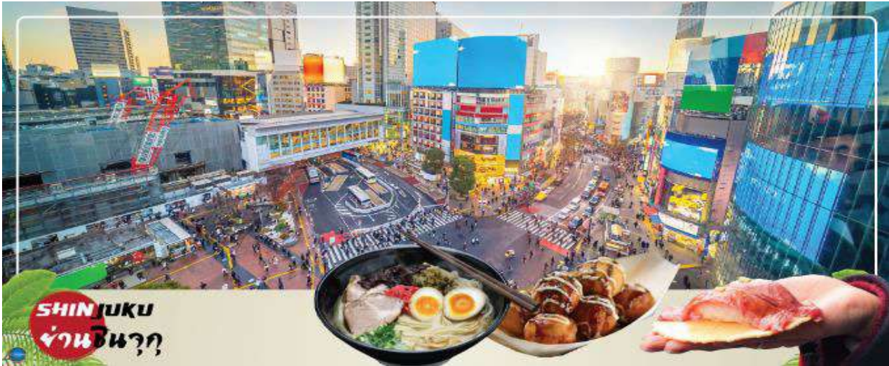
SHINJUKU ย่านชินจูกุ

นำท่านช้อปปิ้ง ย่านชินจูกุ (Shinjuku) ให้ท่านอิสระและเพลิดเพลินกับการช้อปปิ้งสินค้ามากมาย ทั้งเครื่องใช้ไฟฟ้า กล้องถ่ายรูปดิจิตอล นาฬิกา เครื่องเล่นเกม หรือสินค้าที่จะเอาใจคุณผู้หญิงด้วย กระเป๋า รองเท้า เสื้อผ้า แบรินด์เนม เสื้อผ้าแฟชั่นสำหรับวัยรุ่น เครื่องสำอางยี่ห้อดังของญี่ปุ่นไม่ว่าจะเป็น KOSE, KANEBO, SK II, SHISEDO และอื่นๆ อีกมากมาย ห้ามพลาด!!! จุดเช็คอินแห่งใหม่ ของชาวโซเชียล นั่นก็คือ แมวยักษ์ 3 มิติ ที่โผล่บนจอแอลอีดีมีขนาดมหึมา จอมความโค้งขนาด 154 ตารางเมตร (1,664 ตารางฟุต) เสียงที่ออกจากลำโพงคุณภาพเกรดดี ความละเอียดภาพระดับ 4K ถือเป็นเทคโนโลยีระดับสูง ที่ให้ภาพเสมือนจริงปรากฏเป็นภาพเหมือนยิวเดินเล่นไปมาอยู่เหนือกรุงโตเกียว นอกจากแมวยักษ์แล้ว ท่านยังสามารถรับชมโฆษณาต่างๆ ที่ถูกครีเอทให้เป็นภาพ 3 มิติ ผ่านจอแอลอีดีนี้ ไม่ว่าจะเป็น แพนด้า, รองเท้าไนกี้, น้องหมา Pompompurin, จานบิน UFO แม้แต่หุ่นยนต์เครื่องดูดฝุ่น ท่านสามารถรับชมและเก็บภาพได้ตามอัธยาศัย