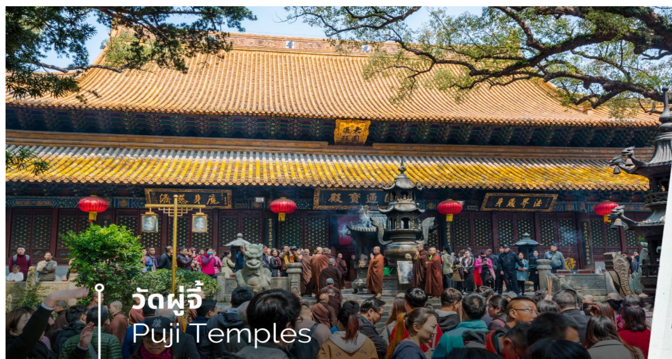
วัดผู้จี้ Puji Temples

นำท่านข้ามเรือสู่ท่าเรือจูเจียเจียน เกาะผู้โถวซาน ซึ่งตั้งอยู่ที่ทะเลเหลียนฮัวหยาง ซึ่งห่างจากอ่าวหางโจว มณฑลเจ้อเจียงไปทางทิศตะวันออกประมาณ 100 ไมล์ทะเล ซึ่งประกอบด้วยเกาะผู้ถ่อซานและลั่วเจียซานและเกาะจูเจียเจีย เกาะผู้ถ่อซานมีเนื้อที่เพียง 12.5 ตรกม วัดต่างๆ บนเกาะเริ่มสร้างในสมัยราชวงศ์ถังและซ่ง และเจริญรุ่งเรืองในสมัยราชวงศ์หมิงและชิง ปัจจุบันนี้ยังเหลือประมาณ 10 วัด นับเป็นภูเขาชื่อดังทางศาสนาพุทธ ติดอันดับหนึ่งในสี่ของจีน และเป็นธรรมสถานของพระอวโลกิเตศวรโพธิสัตว์ (พระแม่กวนอิม) โดยได้ฉายานามว่า “เป็นที่อยู่ของเหล่าเทพ” นำท่านสู่ วัดผู้จี้ วัดในตำนานที่ควรมาเป็นอย่างยิ่ง โดยไฮไลท์ของวัดนี้คือ องค์พระโพธิสัตว์ที่มีเทพลักษณะเป็นชาย เป็นองค์ที่ชาวจีนทั่วโลกให้ความเลื่อมใสศรัทธาสูงสุด ซึ่งวัดผู้จี้เนี่ย เป็นวัดใหญ่ที่สุดบนเกาะที่มีประวัติเก่าแก่นับพันปี แต่เดิมเนี่ยเป็นวัดเล็ก แต่ผ่านร้อนผ่านหนาวมา ตั้งแต่ยุคราชวงศ์ซ่ง หยวน หมิง และชิง จนกระทั่งได้รับพระราชทานนาม “ผู้จี้” จากจักรพรรดิคังซีแห่งราชวงศ์ชิง ส่วนในรัชสมัยของจักรพรรดิหย่งเจิ้งก็ได้รับการบูรณะครั้งใหญ่จน