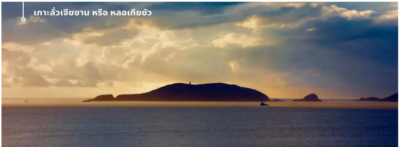
เกาะลั่วเจียซาน หรือ หลอเกียชัว

หลังอาหารนำท่านสู่ ท่าเรือ เพื่อข้ามไปสู่ เกาะลั่วเจียซาน หรือ หลอเกียชัว ซึ่งเป็นเกาะเล็ก ๆ ที่เมื่อมองจากระยะไกลจะดูคล้ายกับพระที่นั่งนอนอยู่บน พื้นผิวทะเล คัมภีร์ทางพุทธศาสนาของจีนได้บันทึกไว้ว่าสถานที่แห่งนี้เป็นที่