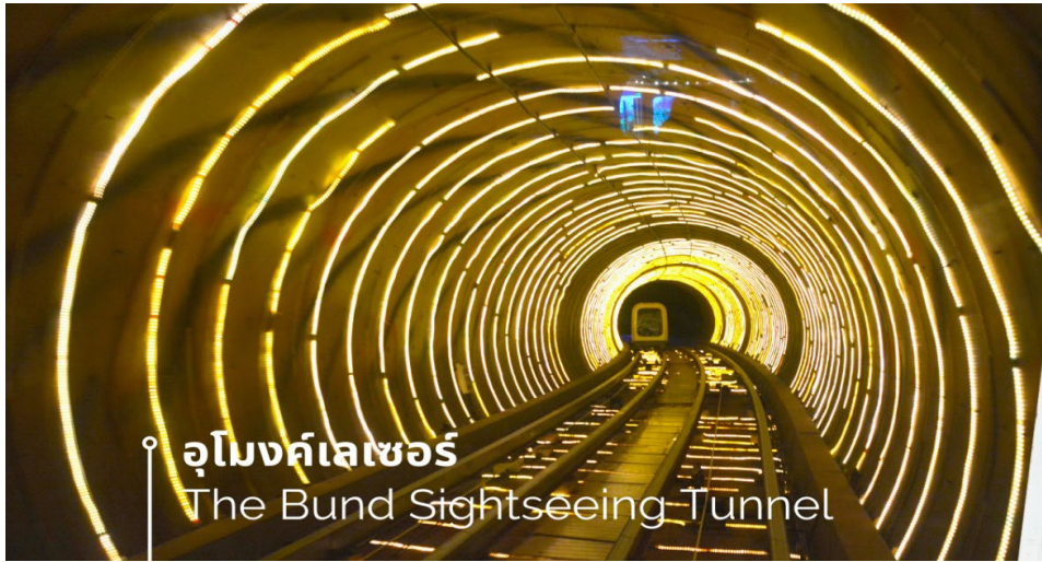
อุโมงค์เลเซอร์ The Bund Sightseeing Tunnel

จากนั้นเดินเลียบบแม่น้ำหวงผู่ จะมีสวนสาธารณะขนาดใหญ่ ริมน้ำอยู่ทางเหนือของ The Bund เห็นหอไข่มุก ตะวันออกมุมไกล แถวนั้นมีห้างสรรพสินค้า ย่านเมืองใหม่ที่กำลังสร้าง ตึกสวยงาม เป็นอีกจุดหนึ่งที่วิวสวย รมรื่น ถ่ายรูปสวยๆได้อีกเยอะเลย