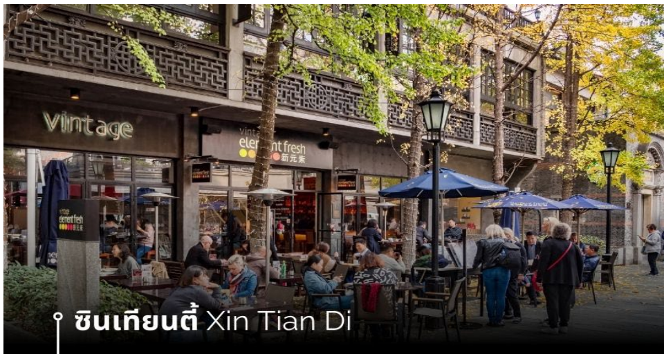
ซินเทียนตี้ Xin Tian Di

🍽️ รับประทานอาหารกลางวันที่ภัตตาคาร (15) หลังจากนั้น เซคอินสุดฮิป ที่ 13DE MARZO หมี่เกาะแก้ว ทุกแก้วที่นำเสิร์ฟเครื่องต้ม จะแถมที่หมี่ตัวจิ๋วน่ารัก ส่งมอบให้ทุกท่าน (แถมฟรี เครื่องต้ม ท่านละ 1 แก้ว) นำท่านเที่ยวชม ซินเทียนตี้ ย่านฮิปเตอร์ใจกลางนครเซี่ยงไฮ้ ที่วัยรุ่นต้องมา กลายเป็นสถานที่ท่องเที่ยวติดอันดับต้นๆ ไปแล้ว สำหรับแหล่งช้อปปิ้งแห่งนี้ ไม่แพ้แหล่งช้อปปิ้งรุ่นพี่ อย่าง ถนนนานกิง ถนนอยู่เจียง Yu Yuan Bazaar ถือว่าเป็นอีก 1 ไฮไลต์เด็ดของนครแห่งนี้ เนื่องจากเอกลักษณ์ที่ไม่เหมือนใคร สิ่งปลูกสร้างที่ใช้อิฐบล็อกแบบสถาปัตยกรรมแบบ Shikumen (ซิกเหมิน) การผสมผสานระหว่างสถาปัตยกรรมตะวันตกกับจีนเข้าด้วยกัน ทางเดินหิน กำแพงหิน