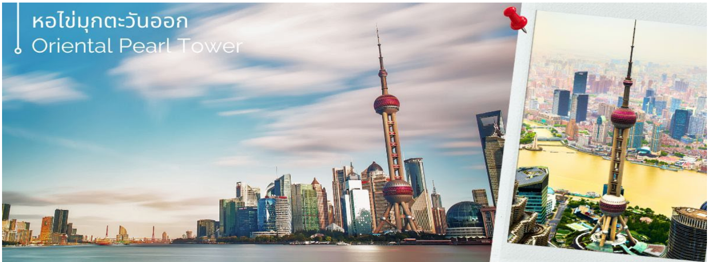
หอไข่มุกตะวันออก Oriental Pearl Tower

จากนั้นนำท่านเดินทางสู่แลนด์มาร์คของเมืองเชียงใหม่ นักท่องเที่ยวทั้งชาวจีนและชาวต่างชาติ ต่างพากันมาถ่ายรูปอย่างไม่ขาดสาย เมื่อมาถึงเมืองเชียงใหม่ นั่นคือ หอไข่มุกตะวันออก Oriental Pearl Tower (ผ่านชม) เป็นหอส่งสัญญาณวิทยุโทรทัศน์สูง 468 เมตร ลักษณะเป็นไข่มุก 11 ลูก และ เสา 3 เสา ด้านบนเป็นรูปไข่มุก 3 เม็ด 3 ขนาดเรียงกันในแนวตั้ง เมื่อชมวิวก่อนถ่ายรูปกันจนพอใจแล้ว นำท่านเดินทางมาทางเข้าอุโมงค์เลเซอร์ ซึ่งเป็นอุโมงค์ลอดแม่น้ำ