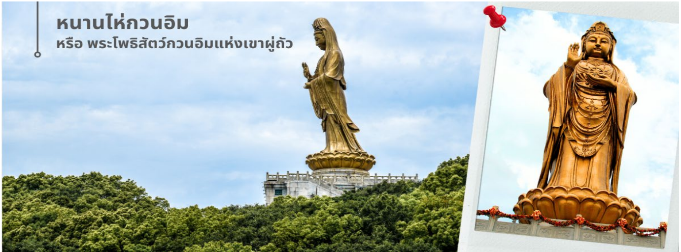
หนานไท่กวนอิม หรือ พระโพธิสัตว์กวนอิมแห่งเขาผู้ถั่ว

จากนั้นนำท่านกราบขอพรพระโพธิสัตว์กวนอิม หนานไท่กวนอิม หรือ พระโพธิสัตว์กวนอิมแห่งเขาผู้ถั่ว องค์ใหญ่ และงดงามที่สุดในเกาะ สูงถึง 28 เมตร ซึ่งประดิษฐานอยู่ที่ตำหนักริมทะเล หรือ หนานไท่กวันยิน เป็นประติมากรรมแบบจีนรูปพระโพธิสัตว์กวนอิม ซึ่งเป็นจุดหมายสำคัญของเขาผู้ถั่ว เมืองโจวซาน ทางตอนตะวันออกของมณฑลเจ้อเจียง ประเทศจีน ประติมากรรมสูง 33 เมตร และหนัก 70 ตัน ได้รับทุนและก่อสร้างโดยผู้ศรัทธาชาวจีนทั้งในและ