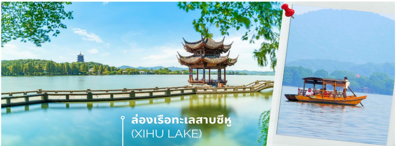
ล่องเรือทะเลสาบซีหู (XIHU LAKE)

นำท่าน ล่องเรือทะเลสาบซีหู (XIHU LAKE) ตั้งอยู่ในเมืองหังโจว ที่นี่สามารถล่องเรือชมความงามของทะเลสาบซีหู นอกจากทิวทัศน์อันงดงามแล้วทะเลสาบแห่งนี้ยังเป็นจุดเริ่มต้นเรื่องราวของ “นางพญางูขาว” ตำนานแห่งความรักสุดยิ่งใหญ่ที่ถูกนำมาทำเป็นภาพยนตร์และละครเวทีที่โด่งดังไปทั่วโลก เมื่อล่องเรือบนทะเลสาบซีหูนอกจากธรรมชาติอันงดงามของทะเลสาบแล้ว สิ่งที่น่าสนใจผู้มาเยือนทะเลสาบแห่งนี้คงหนีไม่พ้น เจดีย์นางพญางูขาว หรือ “เจดีย์เหลยเฟิง” เจดีย์แปดเหลี่ยมสไตล์จีน สูง 5 ชั้นที่ตั้งสูงเด่นอยู่บนยอดเขาทางทิศใต้ของทะเลสาบซีหู เจดีย์แห่งนี้เป็นที่แห่งตำนานความรักอันเลื่องชื่อบรรเลง บัณฑิตหนุ่มรูปร่างงามนามว่า สวีเซียน กับ ไป่ซูเจิน หญิงงามซึ่งเป็นปีศาจงูขาวแปลงกายมาเป็นมนุษย์ ต้มตำกับบรรยากาศสุดแสนโรแมนติก พร้อมรายรอบด้วยสวนไม้นานาพรรณ ต้อนรับฤดูใบไม้ผลิอีกด้วย