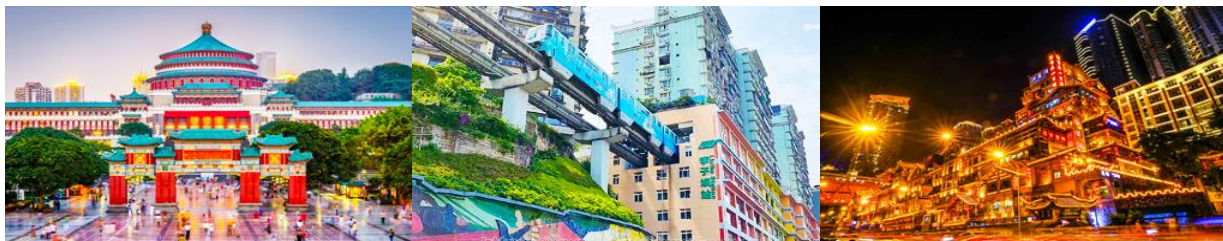
ศาลาประชาชน

ค่ำ รับประทานอาหารค่ำ ณ ภัตตาคาร พักที่ DAWEI YING HOTEL โรงแรมระดับ 4 ดาวหรือเทียบเท่าในเมืองอู่หลง