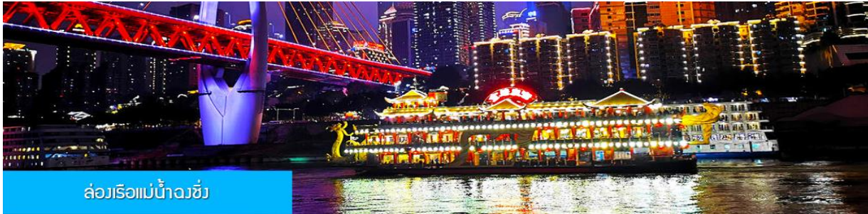
ล่องเรือแม่น้ำจิวซี่

รับประทานอาหารค่ำ ณ ภัตตาคาร (เมนูสุกี้หม่าล่าต้นตำหรับจงชิ่ง)