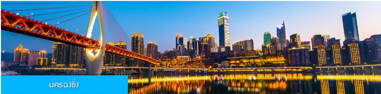
นครฉงชิ่ง