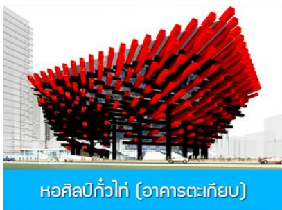
หอศิลป์กั้วไท่ (อาคารตะเกียบ)