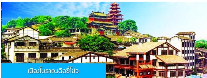
เมืองโบราณฉือชี่ไช่

พักที่ BORRMAN HOTEL โรงแรมระดับ 4 ดาวหรือเทียบเท่าในเมืองจงซิง