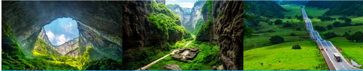
อุทยานหลุมฟ้า