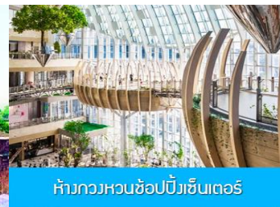
ห้างกวงหวนช้อปปีงเซ็นเตอร์