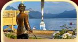
ซาลี แฮปปีนิ THE FORK