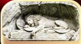
สิงโตหินแกะสลัก