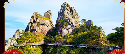
ภูเขาซานซิงซาน