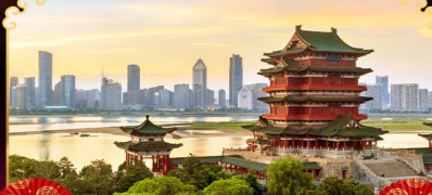
หอถึงหวังเก้อ