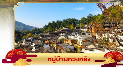
หมู่บ้านหลงหลิ่ง