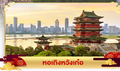
หอเกิ่งหวังเก๋อ