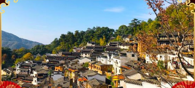
หมู่บ้านหวงหลิง