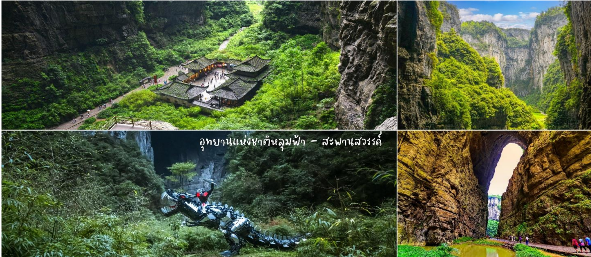
อุทยานแห่งชาติหลุมฟ้า - สะพานสวรรค์

และสะพานแห่งที่สามคือ สะพานมังกรดำ ลักษณะเป็นโตรกหน้าผาอยู่ในส่วนที่แคบที่สุด แสงผ่านเข้าไปน้อย ทำให้ดูค่อนข้างมืดดำ ภายในอุทยานแห่งชาติหลุมฟ้า-สะพานสวรรค์ ยังมีโรงเตี๊ยมเก่าๆ ซึ่งเป็นจุดแวะพักของคนเดินทางในสมัยก่อนตั้งแต่ในสมัยราชวงศ์ถัง (ค.ศ. 618-907) และจุดนี้เองที่จางอี้โหมวใช้เป็นฉากในหนังการถ่ายทำหนังเรื่อง “ศึกโค่นบัลลังก์วังทอง”