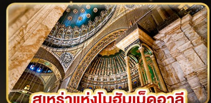
สุเหร่าแห่งโมฮัมเหม็ดอาลี

น้ำหนักกระเป๋า 23Kg. (บินระหว่างประเทศ และบินภายใน)