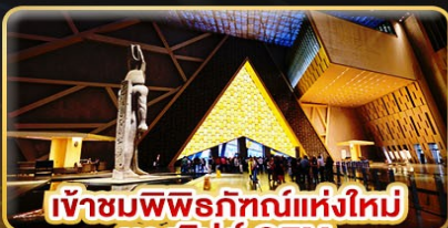
เข้าชมพิพิธภัณฑ์แห่งใหม่ ของยิปต์ GEM

ชม 1 ใน 7 สิ่งมหัศจรรย์ของโลก “มหาพีระมิดแห่งกิซา”