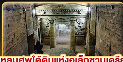
หลุมศพใต้ดินแห่งอเล็กซานเดรีย