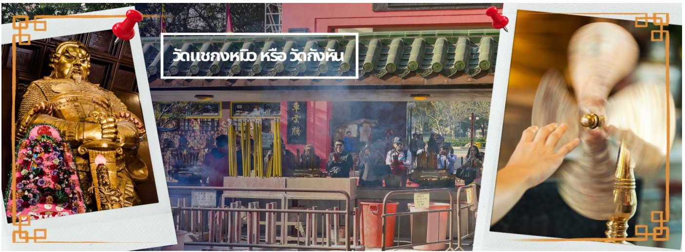
วัดแชกงหมิว หรือ วัดกังหัน

ล่ำลึกถึงตำนานแห่งนักรบราชวงศ์ซ่ง มีนามว่า “แช กง” แม่ทัพปราบศึก ผู้คนทั่วทุกดินแดนต่างยำเกรงในกำลังพลอันกล้าหาญแข็งแกร่งของแม่ทัพแชกง เป็นวัดเก่าแก่ที่มีความศักดิ์สิทธิ์มาก มีอายุกว่า 300 ปีตั้งอยู่ในเขต SHATIN มีประวัติเล่าต่อกันมาว่า ขณะที่แม่ทัพปราบศึก อยู่ที่นี่ ทุกแคว้นเขตแดนแผ่นดินใหญ่ ต่างก็ยำเกรงต่อกำลังพลที่กล้าหาญในกองทัพของท่าน ยามที่ออกรบเพื่อต้านข้าศึกศัตรูทุกทิศทาง ทุก ๆ ครั้ง ท่านใช้สัญลักษณ์รูปกังหัน 4 ใบพัดติดไว้ด้านหน้ารถศึกนำขบวนในกองทัพ เหล่าทหารกล้ามีความเชื่อว่าเมื่อพก พาสัญลักษณ์รูปกังหันนี้ไป ณ ที่ใด ๆ กังหันนี้จะช่วยเสริมสิริมงคล นำพาแต่ความโชคดี มีอำนาจเข้มแข็ง เสริมกำลังใจให้แก่กองทัพของท่าน ชื่อเสียงในการนำทัพสู้ศึกของท่านจึงเป็นตำนาน