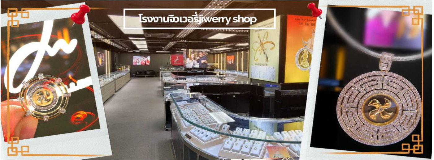
โรงงานจิวเวอรี่ jewelry shop

จากนั้นนำท่านชม โรงงานจิวเวอรี่ ซึ่งเป็นโรงงานที่มีชื่อเสียง ที่สุดของฮ่องกงในเรื่องการออกแบบเครื่องประดับ อาทิ เช่น จี้ และแหวนกำหันทัน ที่สวยงามโดดเด่นไม่เหมือนใคร ซึ่งถือกำเนิดขึ้นที่นี่และมีชื่อเสียงที่สุดใช้เป็นเครื่องประดับติดตัว และเสริมดวงชะตา สินค้าทุกชิ้นมีเอกสารรับประกันคุณภาพเปลี่ยน ซ่อม ได้ตลอดอายุการใช้งาน หากเกิดการชำรุดจากสินค้าไม่ใช่อุบัติเหตุ และนำท่านเลือกซื้อ เครื่องประดับที่ ร้านหยก ซึ่งคนจีนนั้นถือว่าหยกเป็นหิน ที่เป็นตัวแทนของความสวยงามและความบริสุทธิ์ มีความเชื่อว่าหยกมงคล ถ้าพกติดตัวไว้จะอายุยืนและสุขภาพดี