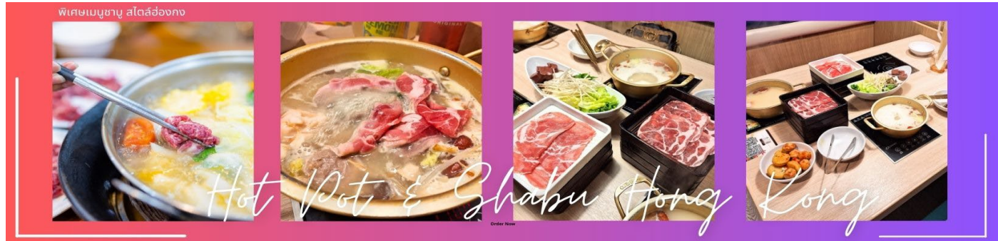
พิเศษเมนูชาบู สไตส์ฮ่องกง

กลางวัน | บริการอาหารกลางวัน ณ ภัตตาคาร พิเศษเมนูชาบู สไตส์ฮ่องกง (5)