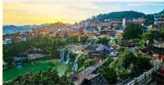
เมืองโบราณฝูหลงเจิน