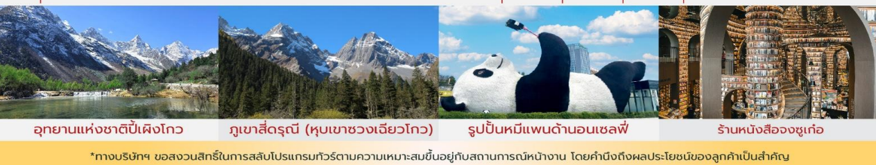
อุทยานแห่งชาติปี่เฟิงโกว ภูเขาสี่ดรุณี (หุบเขาชวงเฉียวโกว) รูปปั้นหมีแพนด้าอนเซลฟ์ ร้านหนังสือจุงเกอ

*ทางบริษัทฯ ขอสงวนสิทธิ์ในการสลับโปรแกรมทัวร์ตามความเหมาะสมขึ้นอยู่กับสถานการณ์หน้างาน โดยคำนึงถึงผลประโยชน์ของลูกค้าเป็นสำคัญ