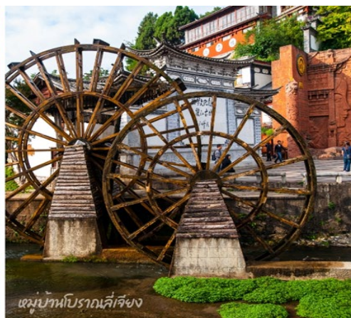
เขมู่บ้านโบราณลี่เจียง

ค่ำ บริการอาหารค่ำ ณ ภัตตาคาร ที่พัก Lajiang Hotel หรือเทียบเท่า 4 ดาวจีน