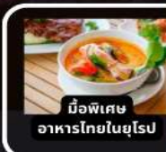
มื้อพิเศษ อาหารไทยในยุโรป