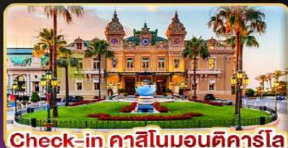
Check-in คาสิโนมอนติคาร์โล