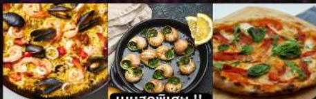
PAELLA ข้าวผัดสเปน / หอยแอสคาโก้ / พืชขามากริด้า