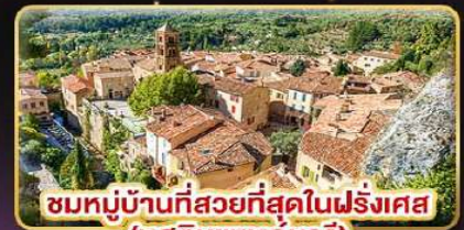
ชมหมู่บ้านที่สวยงามที่สุดในฝรั่งเศส (มูสตียาแซงก์มาร์)