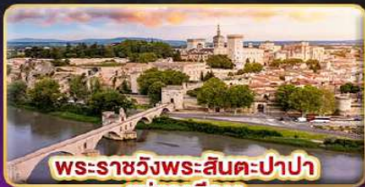
พระราชวังพระสันตะปาปา แห่งอเวิญญ