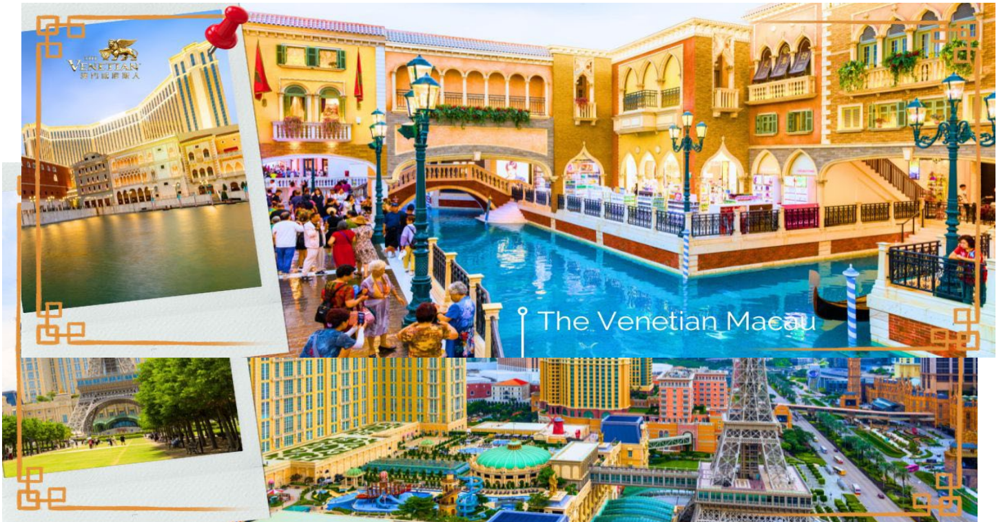
ที่วาดลวดลายเอาไว้อย่างวิจิตรงดงาม

จากนั้นนำท่านสู่ THE VENETIAN โรงแรมหรูในมาเก๊า ภายในมีห้องพักรับรองหลายพันห้อง มีห้องคอมพิวเตอร์ขนาดใหญ่ให้บริการ และมีคาสีโนที่นักพนันและนักท่องเที่ยวระดับไฮโซมาเล่นกันเพื่อความสนุกสนาน มากกว่าเล่นเพื่อผลกำไรเพียงอย่างเดียว ตลอดจนมีแหล่งจับจ่ายระดับโลกรวมอยู่ในที่เดียวกัน และยังมีเรือกอนโดลาบริการสำหรับผู้ต้องการล่องเรือในบรรยากาศเวนิสจำลองด้วยเช่นกัน ในส่วนที่เป็นตัวตึก ซึ่งเป็นที่ตั้งของโรงแรม และคาสีโนนั้น กินพื้นที่มากถึง 980,000 ตารางเมตร สูง 40 ชั้น ภายในตัวอาคารทั้งหมด ถูกออกแบบตามสไตล์อิตาลีเลียน และที่โดดเด่นที่สุด คือเพดาน