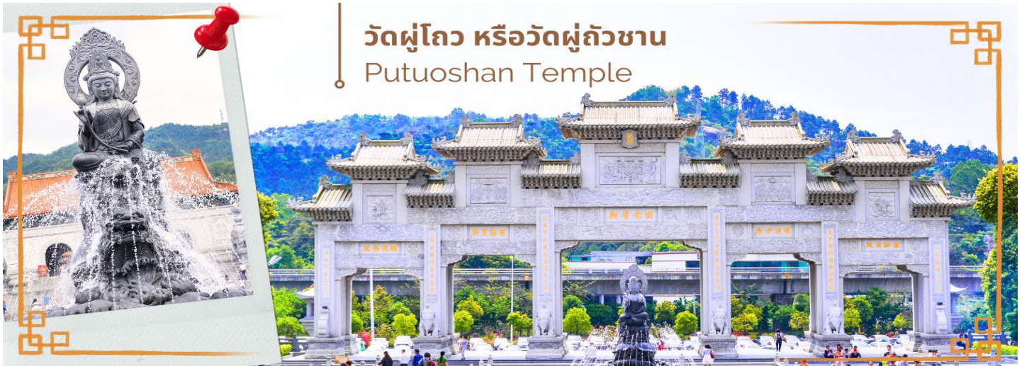
วัดผู้โถว หรือวัดผู้ถัวชาน Putuoshan Temple

จากนั้นนำท่านสู่ วัดผู้โถว หรือวัดผู้ถัวชาน (Putuoshan Temple) ดินแดนอันศักดิ์สิทธิ์ ของพระโพธิสัตว์กวนอิม พุทธศาสนิกายมหายาน พระโพธิสัตว์กวนอิมคืออวตารหนึ่งของพระอมิตาภพุทธเจ้า ซึ่งพระโพธิสัตว์กวนอิม เป็นมหาบุรุษมีวัฒนธรรมโดยรวมกว้างขวางและออกแบบด้วยรูปแบบสถาปัตยกรรมโบราณแบบดั้งเดิม