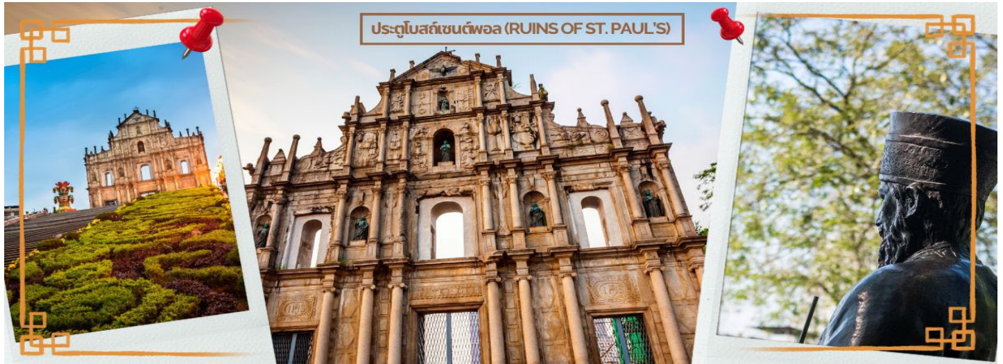
ประตูโบสถ์เซนต์พอล (RUINS OF ST. PAUL'S)

นิยายเอเชียดิด และเข้าใจว่าเป็น ป้อมปราการ ของมาเก๊า ใกล้เคียง กันนั้นคือซากโบราณสถานของวิทยาลัยเซนต์ปอลที่เป็นหลักฐานของมหาวิทยาลัยแบบตะวันตกแห่งแรกในตะวันออกไกลที่มีหลักสูตรการสอนที่ละเอียด ทุกวันนี้ด้านหน้าของซาก