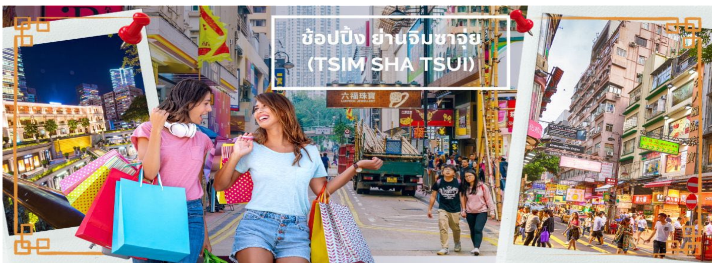
ช้อปปิ้ง ย่านจิมซาจуй (TSIM SHA TSUI)

จากนั้นเดินทางสู่แหล่งช้อปปิ้ง ย่านจิมซาจуй (TSIM SHA TSUI) สัมผัสบรรยากาศร้านเสื้อผ้า ร้านอาหาร และร้านขายเครื่องประดับที่แข่งกันเรียกลูกค้าตลอดแนวถนนที่มีทั้งสินค้าหรูหราและอุปกรณ์อิเล็กทรอนิกส์ ตั้งอยู่บนถนนนาธาน ถนนทอดยาวตั้งแต่ จิมซาจуй จนถึงย่าน ปรีนซ์เฮ็ดเวิร์ด เติมไปด้วยร้านค้าต่างๆมากมายทั้งเสื้อผ้าแบรนด์เนมระดับ HI-END ชื่อดังทั่วโลก ห้างสรรพสินค้าที่ทันสมัย จากถนนนาธานไปที่ถนนแคนตัน ท่านจะตื่นตาตื่นใจไปกับเอาต์เล็ตแบรนด์ที่เรียงติดกันเป็นแถบ นอกจากนี้ยังมี HARBOUR CITY ศูนย์การค้ายักษ์ใหญ่ของฮ่องกง ซึ่งมีร้านค้ากว่า 450 ร้านรวมอยู่ที่นี่ และมี SHOPPING COMPLEX ขนาดใหญ่ชื่อ OCEAN TERMINAL ซึ่งประกอบไปด้วยห้างสรรพสินค้าเรียงรายกันอยู่ และมีทางเชื่อมติดต่อกันสามารถเดินทะลุถึงกันได้ให้แบรนด์ดังมากมายให้ท่านได้เลือกซื้อ ไม่ว่าจะเป็น COACH, LONGCHAMP, LOUIS VUITTON, HEMES, PRADA, GIORDANO, BOSSINI และอีกมากมาย ทางด้านตะวันออก จะมีบาร์และร้านอาหารริมน้ำจำนวนมากให้ท่านได้ผ่อนคลายหลังจากการเดินช้อปปิ้ง ให้พักจิบกาแฟหรือรับประทานอาหารมื้อเที่ยง ชมวิวของอ่าววิกตอเรีย เดินเล่นบริเวณใกล้ๆ จิมซาจуй เริ่มต้นจากหอนาฬิกาสมัยอาณานิคม แลวนี่มีทัศนียภาพที่สวยงามที่สุดแห่งหนึ่งสำหรับการชมวิวตามแนวท่าเรือของเกาะฮ่องกง จิมซาจуйยังอยู่ใกล้กับพิพิธภัณฑ์และแหล่งท่องเที่ยวทางวัฒนธรรมของฮ่องกง อย่างเช่น พิพิธภัณฑ์อวกาศและพิพิธภัณฑ์ศิลปะ เป็นตัวเลือกให้ท่านไปเยี่ยมชมได้อีกด้วย