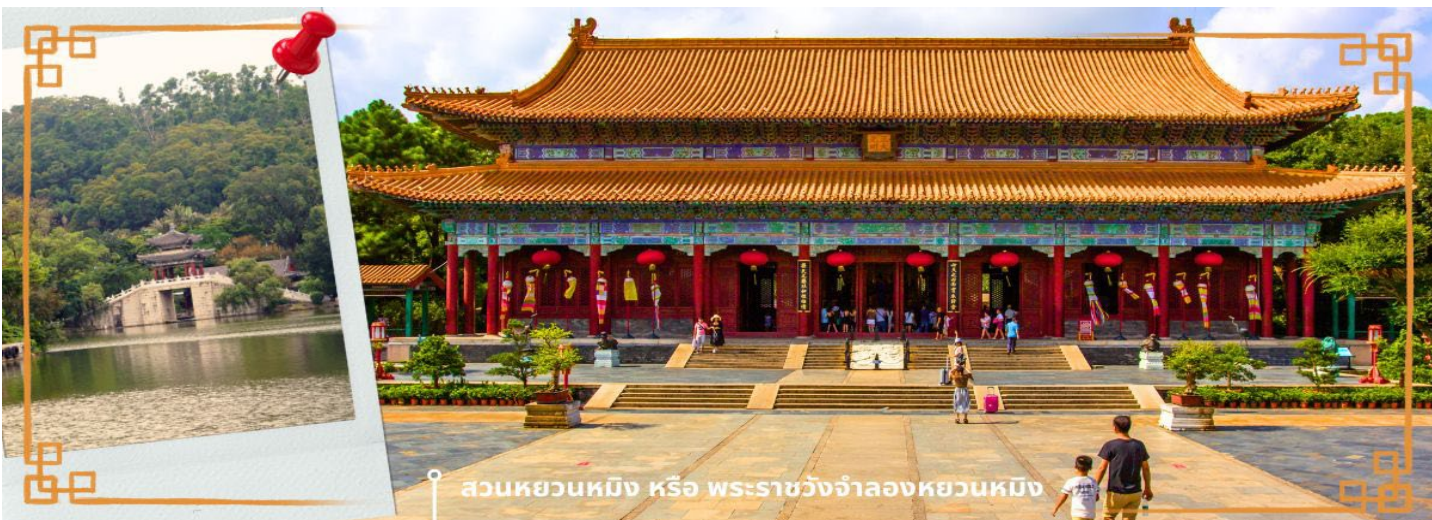
สวนหยวนหมิง หรือ พระราชวังจำลองหยวนหมิง

จากนั้นนำท่านสู่ ร้านหยก หยกในจีนโบราณจนมาถึงสมัยนี้ ยังมีความเชื่อว่าเป็นอัญมณีที่ล้ำค่าและหายาก บ่งบอกฐานะของสตรีในสมัยก่อน แต่ในสมัยนี้ เชื่อกันว่าหยกสีเขียวนั้นเหนียวน่าโชคและความร่ำรวย ดังคำกล่าวที่ว่า“สีเขียวเหนียวทรัพย์” ถือเป็นการเสริมฮวงจุ้ยที่ดีของผู้สวมใส่อิสระให้ท่านได้เรียนรู้ชนิดของหยกและเลือกซื้อตามใจชอบ จากนั้นนำท่านสู่ สวนหยวนหมิง หรือ พระราชวังจำลองหยวนหมิง ตั้งอยู่ ณ ใจกลางหุบเขาชิลิน เมืองจูไห่ สร้างขึ้นเลียนแบบพระราชวังหยวนหมิง ณ กรุงปักกิ่ง สิ่งก่อสร้างต่างๆ มากกว่า 100 ชิ้น มีขนาดเท่าของจริงในอดีตทุกชิ้น อาทิ เสาหินคู่ สะพานข้ามธารทอง ประตูต่างง ตำนกเจิ้งตำกวางหมิง สะพานเก้าเหลี่ยม สวนแห่งนี้โอบล้อมด้วยขุนเขาที่เขียวชอุ่ม และมีพื้นที่ครอบคลุมทะเลสาบขนาดมหึมา ซึ่งมีขนาดเท่ากับสวนเดิมในกรุงปักกิ่ง และยังมีการเพิ่มเติมและตกแต่งสวนที่เป็นศิลปะแบบตะวันตกผสมกับศิลปะจีน