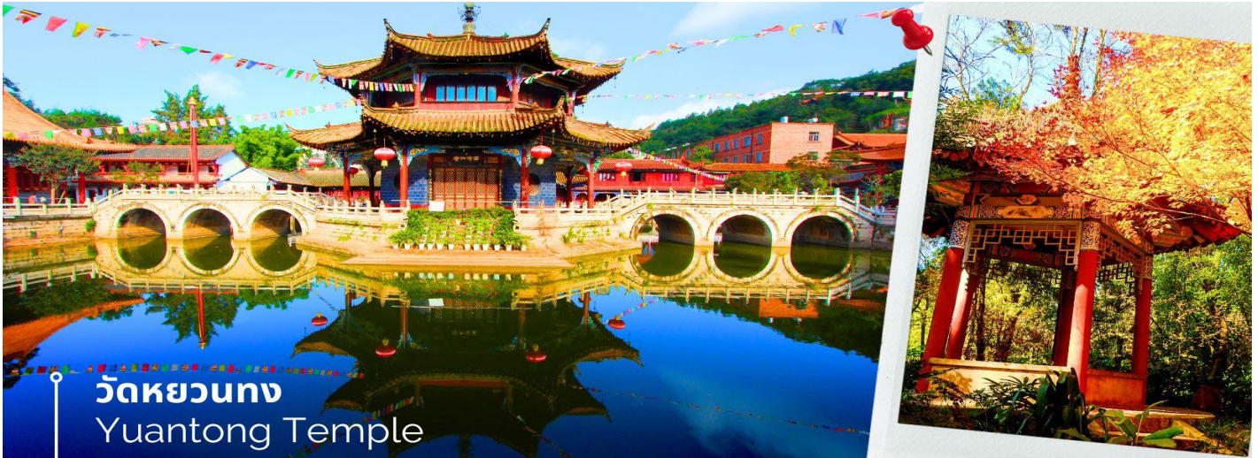
วัดหยวนตง Yuantong Temple

นำท่านชม วัดหยวนตง (Yuantong Temple) วัดแห่งนี้เป็นวัดที่ใหญ่และเก่าแก่ที่สุดในเมืองคุนหมิง สร้างมาตั้งแต่สมัยราชวงศ์ถัง มีอายุยาวนานประมาณ 1,200 กว่าปี การสร้างวัดแห่งนี้จะแปลกตากว่าวัดอื่นในจีน เพราะปกติแล้วการสร้างวัดของจีนส่วนมากจะต้องสร้างอยู่บนภูเขา แต่วัดหยวนตงสร้างวัดต่ำกว่าภูเขา โดยวิหารจะอยู่ต่ำที่สุด เนื่องจากวัดแห่งนี้