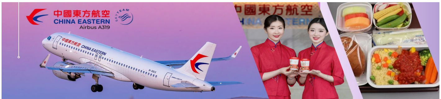
เจ้าหน้าที่ ให้การต้อนรับและอำนวยความสะดวกในการเช็คอินให้แก่ท่าน

Day 1 สนามบินสุวรรณภูมิ - สนามบินนานาชาติคุนหมิงฉางชู่ย- เดินทางเข้าที่พัก 12.30 น. พร้อมกันที่ สนามบินสุวรรณภูมิ อาคารผู้โดยสารขาออก เคาน์เตอร์สายการบิน China Eastern Airline (MU) โดยมี