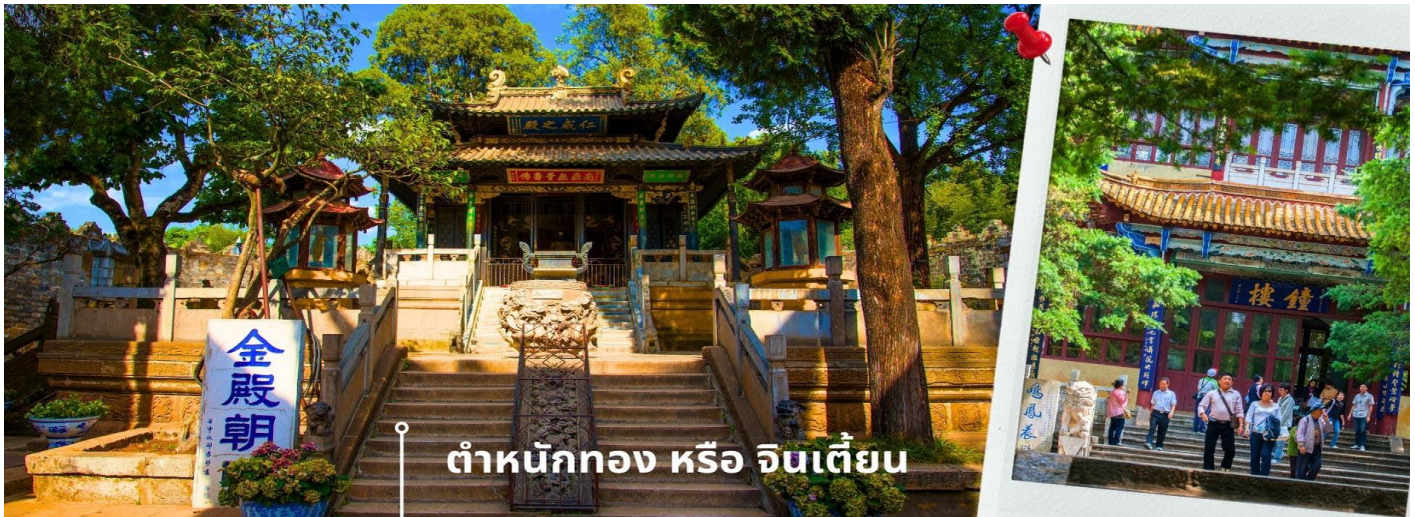
คำหนักทองโดยมีเงินอยู่ (เสวียนอู่) เทพเจ้าลัทธิเต๋าเป็นองค์ประธาน

เช้า รับประทานอาหารเช้า ณ ห้องอาหารโรงแรม (1) นำท่านเยี่ยมชม คำหนักทอง หรือ จินเตี้ยน (The Golden Temple Park | Jindian park) (ไม่รวมค่ารถแบดเตอร์ 10 หยวน/ท่าน) โบราณสถานสำคัญของมณฑลยูนนาน ที่ได้รับการปกป้องดูแลโดยรัฐบาลจีน ตั้งอยู่บริเวณเชิงเขาหมิงเฟิง ล้อมรอบด้วยแนวกำแพงและหอคอยเหมือนเป็นป้อมปราการ คำหนักทองถูกเรียกตามลักษณะอาคารที่มีสีทองอร่าม จากทองเหลืองในส่วนของผนังและหลังคา รวมกว่า 200 ตัน โดยถือเป็นสิ่งปลูกสร้างสัมฤทธิ์ที่ใหญ่ที่สุดของจีน ภายในมีรูป