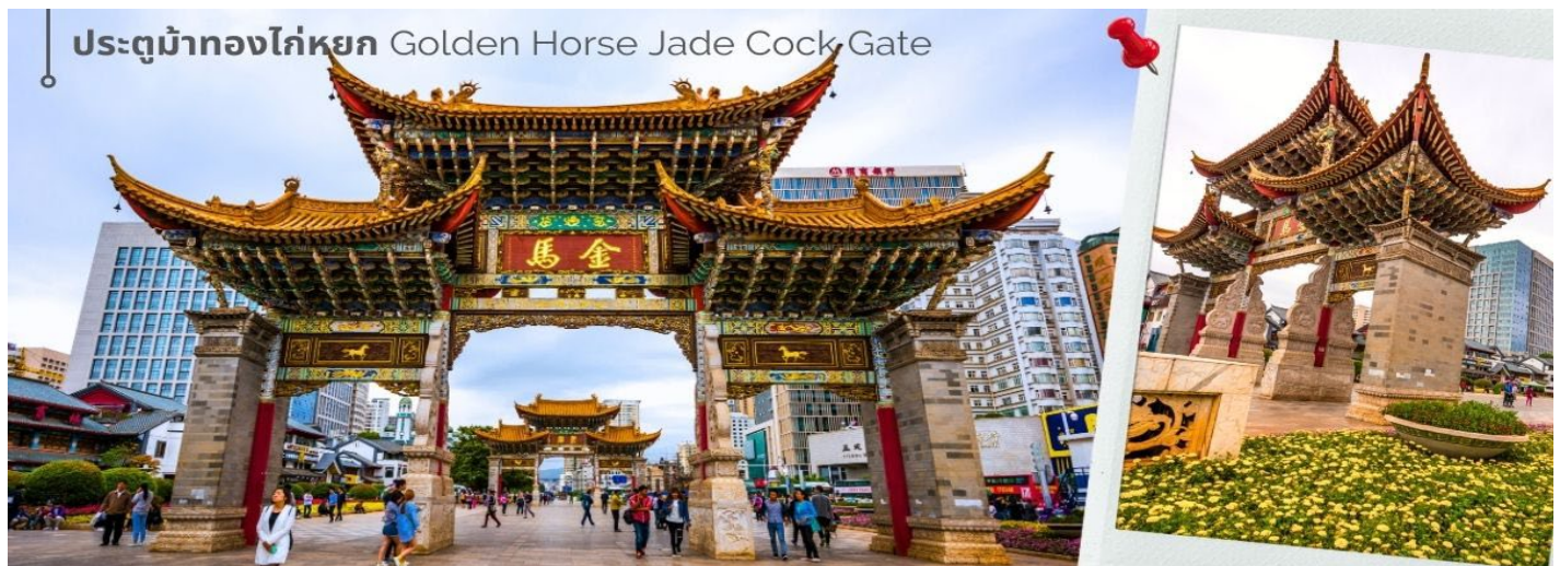
ประตูม้าทองไก่อหยก Golden Horse Jade Cock Gate

ชม ชุมประตุม้าทอง และ ชุมประตูไก่อหยก ซึ่งภาษาจีนเรียกว่าจินหม่า และปี้จี้ จิ้งเอาคำย่อ จินปี้ มาชานานนามถนนแห่งนี้เป็นแหล่งเสื้อผ้าแบรนด์เนมทั้งของจีนและต่างประเทศ รวมทั้งเครื่องประดับ อัญมณี ร้านเครื่องดื่ม และร้านขายของที่ระลึกมากมาย