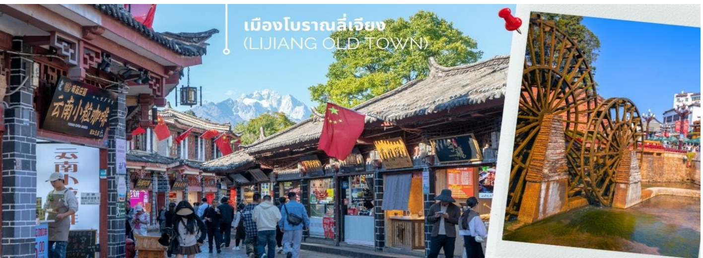
เมืองโบราณลี่เจียง (LIJIANG OLD TOWN)

นำท่านเดินทางชม เมืองเมืองโบราณลี่เจียง (LIJIANG OLD TOWN) หรือ เมืองโบราณต้าเอี้ยนเจิ้น เมืองเก่าแก่อายุกว่า 800 ปี ซึ่งภายในเมืองเก่านั้นงดงามไปด้วยสถาปัตยกรรมบ้านเรือนสไตล์จีนเก่าแก่ที่หาชมได้ยาก และได้รับการอนุรักษ์ไว้อย่างดี บางหลังเหมือนโรงเตี๊ยมโบราณที่เคยเห็นตามหนังจีนย้อนยุค บ้านเรือนส่วนใหญ่ถูกปรับเปลี่ยนให้กลายมาเป็น