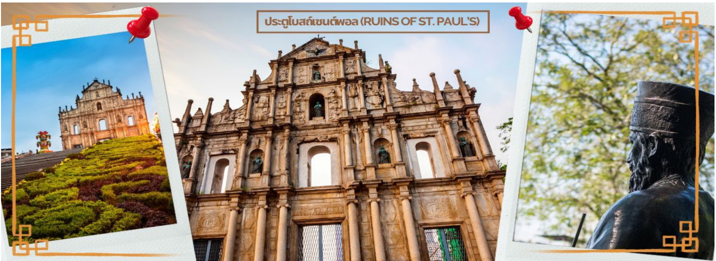
ประตูโบสถ์เซนต์พอล (RUINS OF ST. PAUL'S)

จากนั้นนำท่านชม วิหารเซนต์ปอล (RUINS OF ST. PAUL) หรือ ซากประตูโบสถ์เซนต์ปอลคือด้านหน้าของโบสถ์มาแตร์ เดอที่ถูกรื้อสร้างขึ้นในปี ค.ศ. 1602 - ค.ศ. 1640 ที่ถูกทำลายจากเหตุการณ์ไฟไหม้ในปี ค.ศ. 1835 และซากของวิทยาลัย เซนต์ปอลที่อยู่ถัดไปจากโบสถ์ ทั้งโบสถ์มาแตร์ เดอเดิม วิทยาลัยเซนต์ปอล และป้อมปราการเป็นสิ่งปลูกสร้างของพระ นิกายเยซูอิต และเข้าใจว่าเป็น ป้อมปราการ ของมาเก๊า ไกล่ๆ กันนั้นคือซากโบราณสถานของวิทยาลัยเซนต์ปอลที่เป็น หลักฐานของมหาวิทยาลัยแบบตะวันตกแห่งแรกในตะวันออกไกลที่มีหลักสูตรการสอนที่ละเอียด ทุกวันนี้ด้านหน้าของซาก