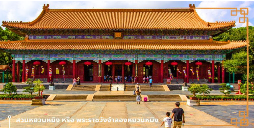
สวนหยวนหมิง หรือ พระราชวังจำลองหยวนหมิง