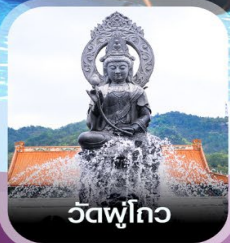
วัดฟุโกว