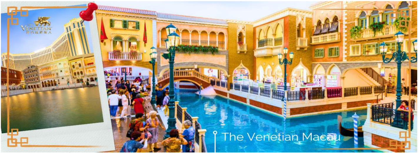
The Venetian Macau

จากนั้นนำท่านชม วิหารเซนต์ปอล (RUINS OF ST. PAUL) หรือ ซากประตูโบสถ์เซนต์ปอลคือด้านหน้าของโบสถ์มาแตร์ เดอที่ถูกรื้อสร้างขึ้นในปี ค.ศ. 1602 - ค.ศ. 1640 ที่ถูกทำลายจากเหตุการณ์ไฟไหม้ในปี ค.ศ. 1835 และซากของวิทยาลัย เซนต์ปอลที่อยู่ถัดไปจากโบสถ์ ทั้งโบสถ์มาแตร์ เดอเดิม วิทยาลัยเซนต์ปอล และป้อมปราการเป็นสิ่งปลูกสร้างของพระ นิกายเยซูอิต และเข้าใจว่าเป็น ป้อมปราการ ของมาเก๊า ไกล่ๆ กันนั้นคือซากโบราณสถานของวิทยาลัยเซนต์ปอลที่เป็น หลักฐานของมหาวิทยาลัยแบบตะวันตกแห่งแรกในตะวันออกไกลที่มีหลักสูตรการสอนที่ละเอียด ทุกวันนี้ด้านหน้าของซาก