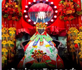
เจ้าแม่กวนอิมสองอ้า