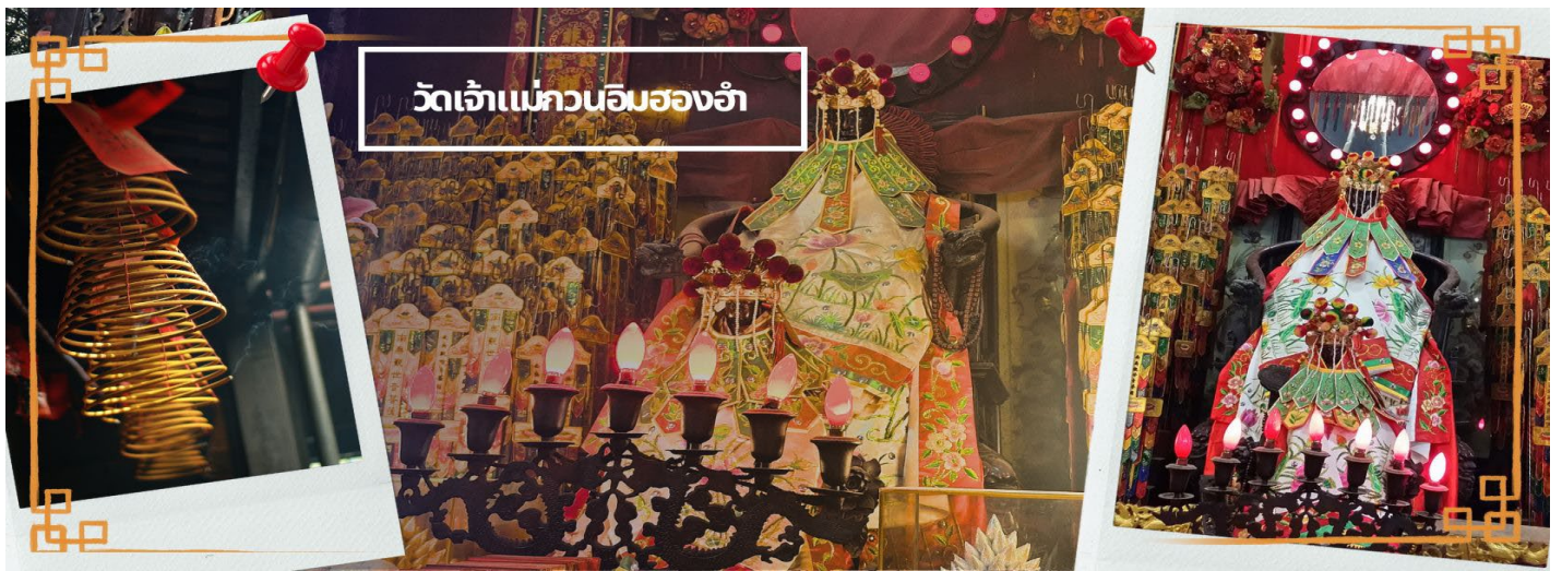
วัดเจ้าแม่กวนอิมฮองฮา

จากนั้นนำท่านเดินทางสู่ วัดเจ้าแม่กวนอิมฮองฮา (HUNG HOM KWUN YUM TEMPLE) เป็นหนึ่งในวัดที่ชาวฮองกงนั้นเลื่อมใสกันมาก ด้วยความที่เจ้าแม่กวนอิมนั้นเป็นเทพเจ้าแห่งความเมตตา ฉะนั้นเมื่อใครมีทุกข์ร้อนอะไรก็มักจะมากราบไหว้ขอพรให้เจ้าแม่ช่วยเหลือ วัดนี้ถูกสร้างขึ้นในปี ค.ศ.1873 ในช่วงสงครามโลกครั้งที่ 2 มีการปล่อยระเบิดลงบริเวณวัดฮองฮาหลายต่อหลายครั้ง ทำให้มีผู้บาดเจ็บและล้มตายมากมาย แต่ชาวบ้านที่หนีเข้าไปหลบภัยในวัดนี้ก็กลับปลอดภัยและตัววัดก็ไม่ได้ได้รับความเสียหายจากเหตุการณ์ทิ้งระเบิดที่น่าอัศจรรย์ และวันสำคัญอีกวันหนึ่งที่คนหลังไหลมาไหว้ขอพรอย่างไม่ขาดสาย และรอคอยเป็นประจำทุกปี ก็คือ "วันเปิดทรัพย์" หรือ วันยืมเงินเทพเจ้า เป็นวันที่จะมาขอ