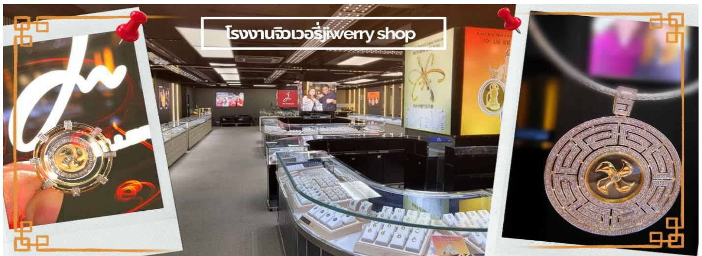
โรงงานจิวเวอรี่jewerry shop

พรและยืมเงินเจ้าแม่กวนอิม ซึ่งตรงกับวันที่ 26 นับจากวันตรุษจีน ซึ่งพิธีนี้ใน 1 ปี มีเพียงครั้งเดียวเท่านั้น จากนั้นนำท่านชม โรงงานจิวเวอรี่ ซึ่งเป็นโรงงานที่มีชื่อเสียงที่สุดของฮองกงในเรื่องการออกแบบเครื่องประดับ อาทิเช่น จี้และแหวนกำหัตน์ ที่สวยงามโดดเด่นไม่เหมือนใคร ซึ่งถือกำเนิดขึ้นที่นี่และมีชื่อเสียงที่สุดใช้เป็นเครื่องประดับติดตัว และ