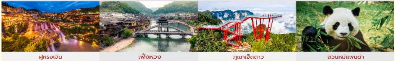
ฝูหรงเจิน เฟิ่งหวง ภูเขาเจ็ดดาว สวนหมีแพนด้า

*ทางบริษัทฯ ขอสงวนสิทธิ์ในกรลสืบโปรแกรมทัวร์ตามความเหมาะสมขึ้นอยู่กับสถานการณ์ปัจจุบัน โดยค่าใช้จ่ายผลประโยชน์ของลูกค้าเป็นสิ่งสำคัญ