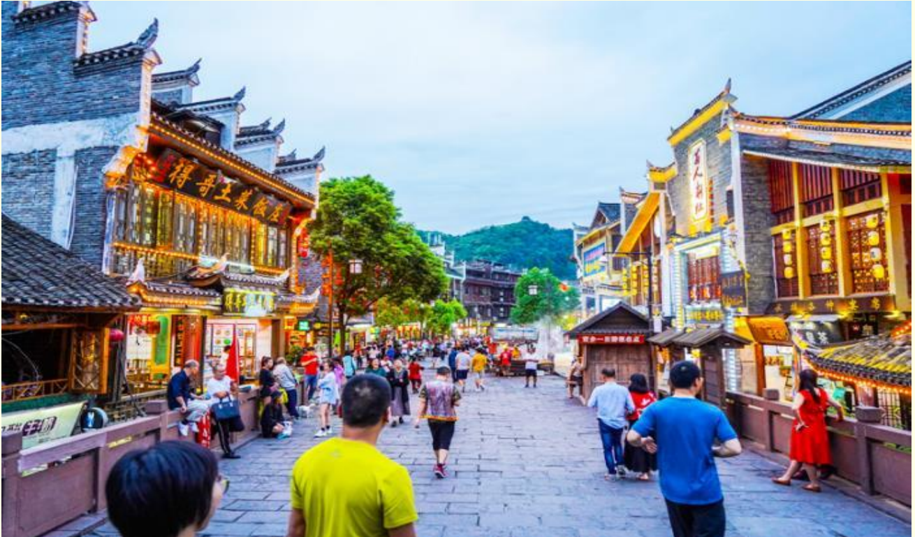
นำท่านชม สะพานสายรุ้ง สะพานไม้โบราณที่มีหลังคาคลุมเหมือนสะพานข้ามคลองในเวนิส สะพานแห่งนี้เคยเป็นด่านเก็บภาษีเกลือในสมัยราชวงศ์ชิง ซึ่งยังคงรักษารูปทรงในอดีตไม่เปลี่ยนแปลง