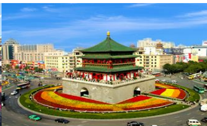
จัตุรัสหอกลอง