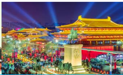
Nightless City of Great Tang