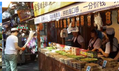
ตลาดมุสลิม