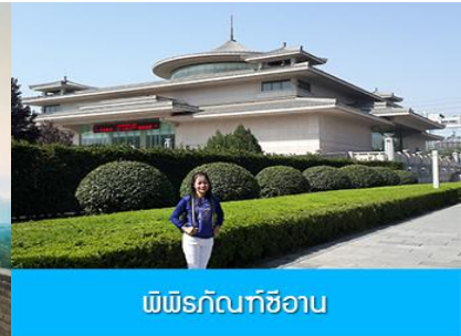
พิพิธภัณฑ์ซีอาน

วันที่ห้า เมืองซีอาน-กำแพงเมืองซีอาน-พิพิธภัณฑ์ซีอาน-วัดลามะ -จัตุรัสหอกลอง-ตลาดมุสลิม-เมืองยู่นเจิง