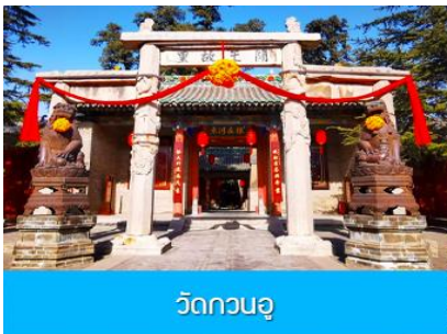
วัดกวนอู