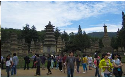
ป่าเจดีย์