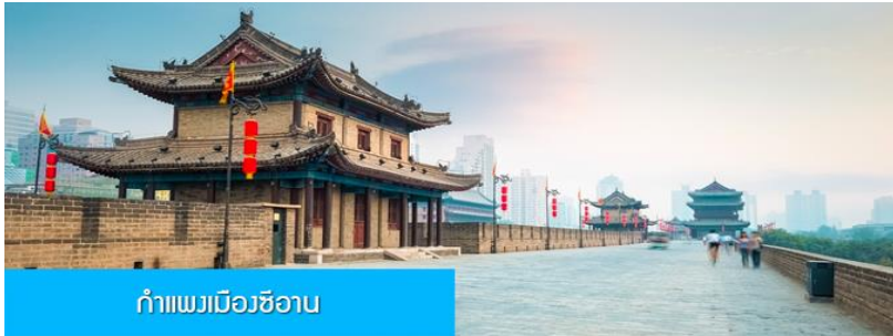
กำแพงเมืองซีอาน

พักที่ HOLIDAY INN EXPRESS HOTEL โรงแรมระดับ 4 ดาวท้องถิ่น หรือเทียบเท่าใน เมืองซีอาน