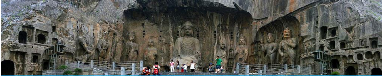
ถ้ำหินหลงเหมิน

หลังอาหารนำท่านเดินทางโดยรถบัสสู่เมืองลั่วหยาง (ระยะทาง 76 กม. ใช้เวลาเดินทางราว 1 ชั่วโมงเศษ)