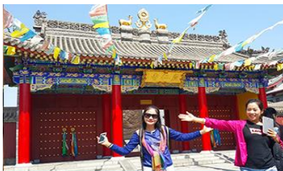
วัดลามะ หรือกว้างเหรินชื่อ