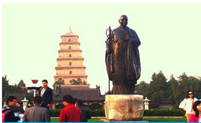
เจดีย์ห่านป่าใหญ่