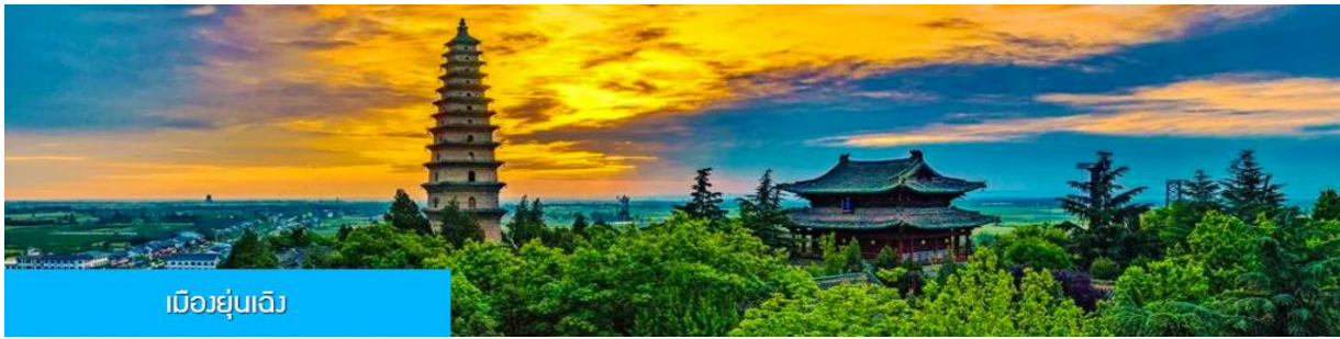
เมืองยู่เฉิง