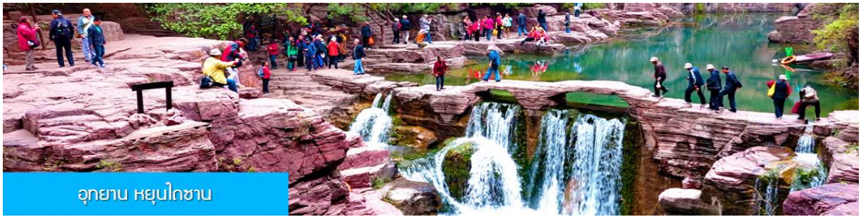
อุทยาน หยุนไถซาน

หลังอาหารนำท่านเที่ยวชม อุทยาน หยุนไถซาน 云台山 อุทยานท่องเที่ยวระดับ 5A ของจีนในมณฑลเหอหนานทางภาคกลางของจีน เป็นทั้งอุทยานท่องเที่ยวเชิงธรณีวิทยา และวนอุทยานท่องเที่ยวธรรมชาติที่ยังคงไว้ซึ่งผืนป่าที่สมบูรณ์ ด้วยลักษณะภูมิประเทศที่โดดเด่นสลับกับยอดเขาสูง มักมีเมฆหมอกปกคลุมทำให้เกิดเป็นทัศนียภาพที่สวยงามขงหลงไหล จนเป็นที่มาของชื่ออุทยาน หยุนไถซาน ที่แปลว่า ภูเขาระเบียงเมฆ..... นำท่านเดินชมและเก็บภาพความสวยงามของภูเขา หน้าผา น้ำตก ธารน้ำในอุทยาน ฯ (ค่าทัวร์รวมค่ารถบัสรับส่ง และบันไดเลื่อนในอุทยาน) จนสมควรแก่เวลานำท่านเดินทางเข้าโรงแรมที่พัก