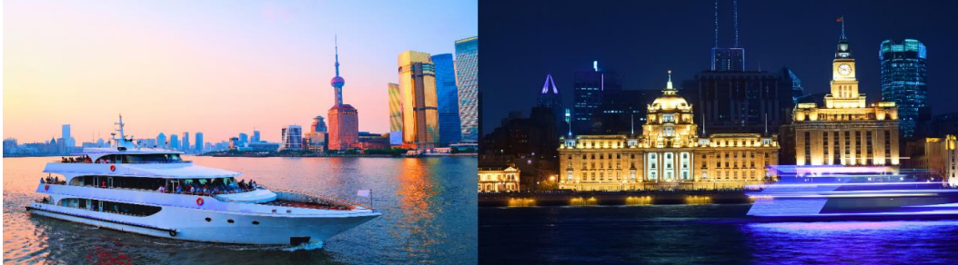
อิสระอาหารค่ำเพื่อความสะดวกในการท่องเที่ยว

Option tour : ล่องเรือแม่น้ำหวงผูเจียง+บะหมี่ปู ราคา 400 หยวน/ท่าน สัมผัสบรรยากาศบนแม่น้ำหวงผูเจียง โดยเรือจะล่องผ่านสถานที่ท่องเที่ยวชื่อดัง เช่น The bund, หอไข่มุก, และตึกสูงตระหง่า เพลิดเพลินกับการชมทิวทัศน์แสนสวยงามยามค่ำคืน