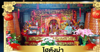
ไต้ตังม่า