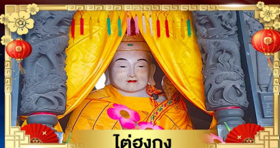
ไต้ซ่งกง

“เขื่อนกันเจ้าสาว” ไปแล้วปัง..กลับมาแล้วเฮง!!