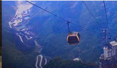
กระเช้าขึ้นเขาเทียนเหมินซาน