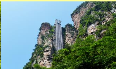
ลิฟท์แก้วไปหลง