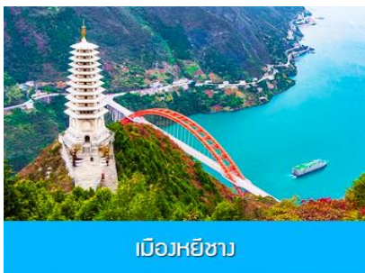
เมืองหยีซาง