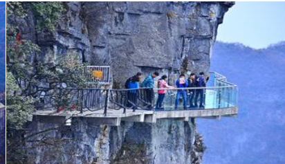
หน้าพลาวย้ำกาวเดินกระจก