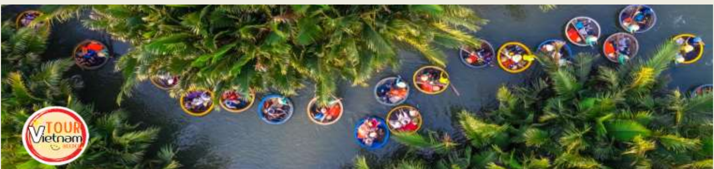
หน้า 8 (ภาพใช้เพื่อการโฆษณาเท่านั้น)

จากนั้นเดินทางต่อไปยัง หมู่บ้านแกะสลักหินอ่อน ซึ่งเป็นหมู่บ้านที่เก่าแก่และยึดถืออาชีพการแกะสลักหินอ่อนมาช้านาน เป็นร้านของฝากท้องถิ่นที่มีสินค้ามากมาย จากนั้นแวะ ช้อปปิ้งร้านกาแฟ เลือกซื้อของฝาก