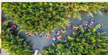
ล่องเรือกระดาง

*กรณีห้องพักบานาฮิลล์เต็ม ขอสงวนสิทธิ์ในการเปลี่ยนวันเข้าพัก และปรับเปลี่ยนโปรแกรมโดยคำนึงถึงผลประโยชน์ลูกค้าเป็นสำคัญ