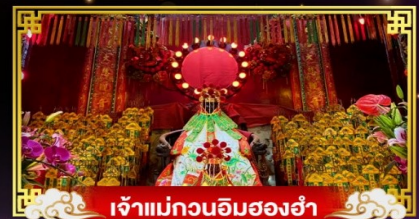
เจ้าแม่กวนอิมสองอ่า