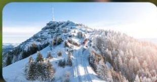
พิชิต 3 ยอดเขาดัง Rigi / Schilthorn / Gornergrat