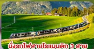
นั่งรถไฟสายโรแมนติก 3 สาย Golden Pass / Luzern Interlaken Express / Gornergrat