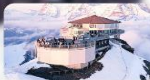
ทานอาหารที่ Piz Gloria กั้ตาคารกั้หมุนได้ 360 องศา