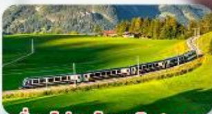
นั้รถไฟสายโรเมนติก 2 สาย Golden Pass / Luzern Interlaken Express