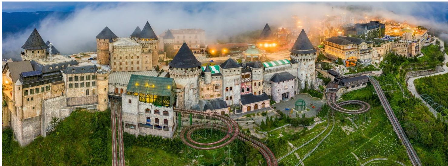
ที่พัก : Mercure Banahill French Village Hotel 4*

Highlight เป็นโรงแรมสไตล์หมู่บ้านฝรั่งเศสศตวรรษที่ 19 ตั้งอยู่ในทำเลที่ยอดเยี่ยมบนยอดเขาบานาฮิลล์ เมืองดานัง ประเทศเวียดนาม โรงแรมมีสิ่งอำนวยความสะดวกมากมาย เหมาะกับทุกเพศทุกวัย ใหญ่กว่านได้ใช้เวลาแสนพิเศษและน่าจดจำที่นี่ได้เลย