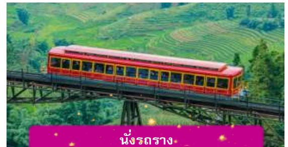
นั่งรถราง

เที่ยง บริการอาหารกลางวัน ณ ภัตตาคาร พิเศษ ... เมนูบุฟเฟ่ฟานซิปัน