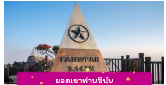
ยอดเขาฟานซิปัน