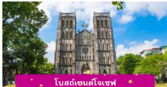
โบสถ์เซนต์โจเซฟ