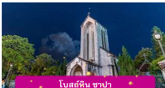
โบสถ์หิน ซาปา