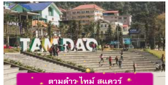
ตามดาว ไทม์ สแควร์

อิสระท่าน ตลาดกลางคืนตามดาว เมื่อแสงแดดลับขอบเขา เมืองบนดอยแห่งนี้จะค่อย ๆ เปลี่ยนบรรยากาศเป็นความคึกคักแบบเรียบง่าย ตลาด กลางคืนตามดาวเต็มไปด้วยของกินพื้นเมือง กลิ่นหอมของหมูย่าง ไชนกกระทา และข้าวโพดย่างลอยคลุ้งไปทั่ว นักท่องเที่ยวเดินจับจ่าย พู ดคุย และ หยุดถ่ายรูปตามแสงไฟที่ประดับอยู่ทั่วตลาด บรรยากาศเป็นกันเองและอบอุ่น เหมาะกับการเดินเล่น ปิดท้ายวันด้วยความสุขเล็ก ๆ ที่สัมผัสได้