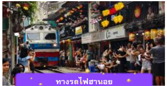
ทางรถไฟฮานอย

เช้า บริการอาหารเช้า ณ ห้องอาหารของโรงแรม หลังจากนั้นนำท่านเดินทางสู่ ทางรถไฟฮานอย เป็นแหล่งท่องเที่ยวที่ได้รับความนิยมในกรุงฮานอย ประเทศเวียดนาม จุดเด่นของที่นี่คือทางรถไฟที่วิ่งผ่านย่านชุมชนที่อยู่อาศัย ทำให้เกิดภาพวิถีชีวิตที่แปลกตาและเป็นเอกลักษณ์ ท่านสามารถทดลองชิมกาแฟต่างๆจากเวียดนามได้ที่นี้ อาทิ กาแฟนมเวียดนามที่มีความเข้มข้น กาแฟไข่มูนุ่มวลหอมละมุน หรือกาแฟเกลือที่ให้ความรู้สึกแปลกแต่อร่อยอย่างบอกไม่ถูก (ไม่รวมค่าเครื่องดื่ม)