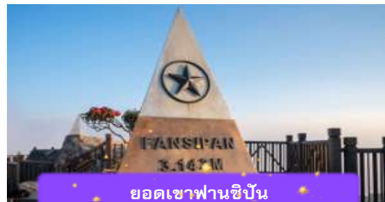
ยอดเขาฟานซิปัน