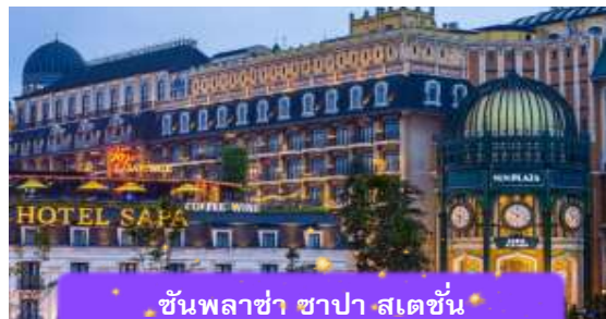
ชั้นพลาซ่า ซาปา สเตชั่น