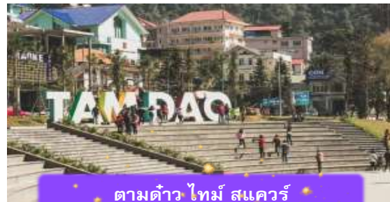
ตามด้าว ไทม์ สแควร์

ที่พัก A25 LUXURY HOTEL ระดับ 4 ดาวมาตรฐานท้องถิ่น หรือเทียบเท่า