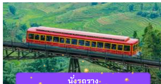
นั่งรถราง

เที่ยง บริการอาหารกลางวัน ณ ภัตตาคาร พิเศษ ... เมนูบุฟเฟ่ต์ฟานซิปัน