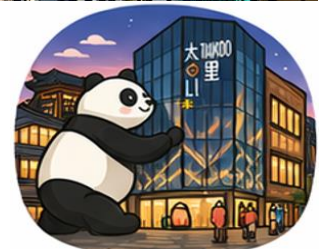
ถนนคนเดินไท่กู่หลี่ (Taikoo Li)

จากนั้นอิสระท่าน ถนนคนเดินชุนซีหลู่ ย่านช้อปปิ้งชื่อดังและคึกคักที่สุดของเมือง เต็มไปด้วยห้างสรรพสินค้า ร้านแบรนด์ดัง ร้านอาหาร และสตรีทฟู้ด เหมาะสำหรับช้อปปิ้งและสัมผัสวิถีชีวิตคนเมือง และ ถนนคนเดินไท่กู่หลี่ แหล่งช้อปปิ้งไลฟ์สไตล์สุดทันสมัย ผสมผสานสถาปัตยกรรมจีนโบราณกับดีไซน์โมเดิร์นอย่างลงตัว รวบรวมด้วยร้านค้าแบรนด์ดัง คาเฟ่ และมุมถ่ายรูปสวยๆ มากมาย