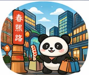
ถนนคนเดินชุนซีหลู่ (Chunxi Road)

จากนั้นอิสระท่าน ถนนคนเดินชุนซีหลู่ ย่านช้อปปิ้งชื่อดังและคึกคักที่สุดของเมือง เต็มไปด้วยห้างสรรพสินค้า ร้านแบรนด์ดัง ร้านอาหาร และสตรีทฟู้ด เหมาะสำหรับช้อปปิ้งและสัมผัสวิถีชีวิตคนเมือง และ ถนนคนเดินไท่กู่หลี่ แหล่งช้อปปิ้งไลฟ์สไตล์สุดทันสมัย ผสมผสานสถาปัตยกรรมจีนโบราณกับดีไซน์โมเดิร์นอย่างลงตัว รวบรวมด้วยร้านค้าแบรนด์ดัง คาเฟ่ และมุมถ่ายรูปสวยๆ มากมาย