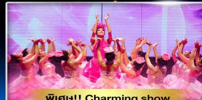
พิเศษ!! Charming show