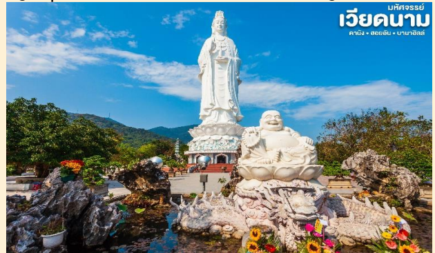
เวียดนาม ดานัง • ฮอยอัน • บานาฮิลล์

สักการะ วัดลินห์อึ้ง (Linh Ung) เป็นวัดที่ใหญ่ที่สุดของเมืองดานังภายในวิหารใหญ่ของวัดเป็นสถานที่บูชาเจ้าแม่กวนอิมและเทพองค์ต่างๆตามความเชื่อของชาวบ้านแถบนี้ นอกจากนี้ยังมีรูปปั้นปูนขาวเจ้าแม่กวนอิมซึ่งมีความสูงถึง 67 เมตรตั้งอยู่บนฐานดอกบัวกว้าง 35 เมตรยื่นหันหลังให้ภูเขาและหันหน้าออกทะเลคอยปกป้องคุ้มครองชาวประมงที่ออกไปหาปลา นอกชายฝั่งวัดแห่งนี้นอกจากเป็นสถานที่ศักดิ์สิทธิ์ที่ชาวบ้านมากราบไหว้บูชาและขอพรแล้วยังเป็นอีกหนึ่งสถานที่ท่องเที่ยวที่สวยงามเป็นอีกหนึ่งจุดชมวิวที่สวยงามของเมืองดานัง และแวะให้ท่านเลือกชมและซื้อของฝากเป็นที่ระลึกที่ ร้านเยื่อไผ่