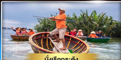
นั่งเรือกระด้ง

เที่ยวบานาฮิลล์ บินร่วมกับสายการบินระดับโลก